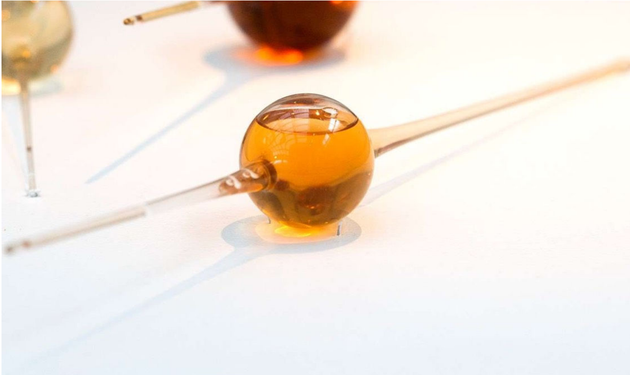
Ampoule en verre soufflé, Chenin 1947 Jean-Bernard Métais

chez eux. Petit à petit, on s'attache aux gens qui vous achètent des choses. Ils vous invitent chez eux, vous cherchez avec eux la meilleure place pour la pièce. Vous rentrez dans leur intimité. Et toutes ces personnes qui ont des goûts communs constituent une communauté. Au fil des ans, on s'intéresse de plus en plus aux gens, c'est clair» .