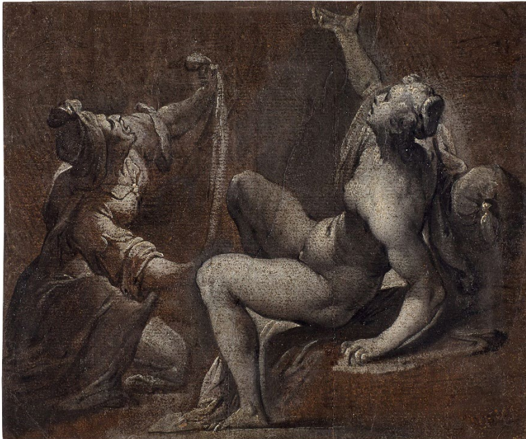
Calvaert