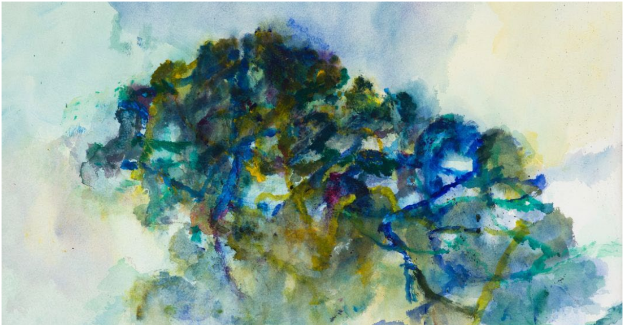
Alexandre Hollan, "Chene dansant", acrylique sur papier, 70x90cm, 2024

À Paris, le Salon du Dessin et Drawing Now, deux manifestations emblématiques du dessin passé et contemporain, accueillent pas moins de douze galeries belges.