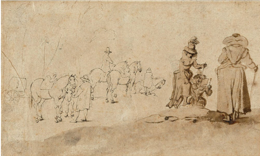
Jan Bruegel l'Ancien