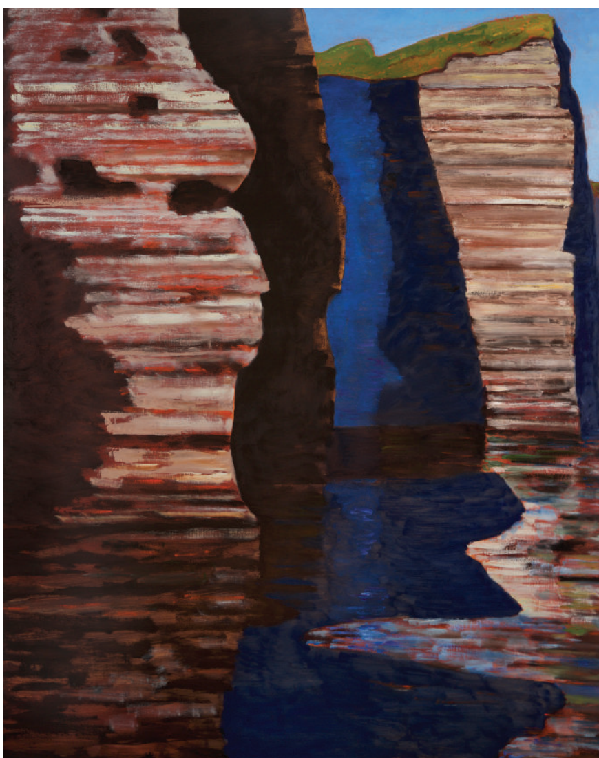
Guy de Malherbe, Falaises , huile sur toile, 114 x 146 cm, 2025

A B J D Nocturne du Jeudi des Beaux-Arts exceptionnellement le mercredi 6 mai de 18h à 21h Rencontre avec l'artiste