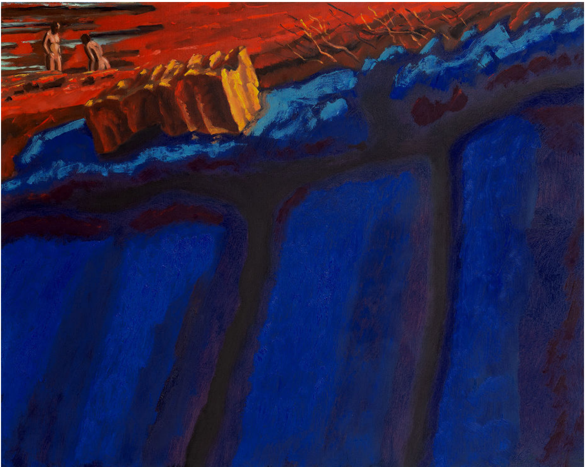
Guy de Malherbe, Rivages , huile sur toile, 65 x 81 cm, 2025