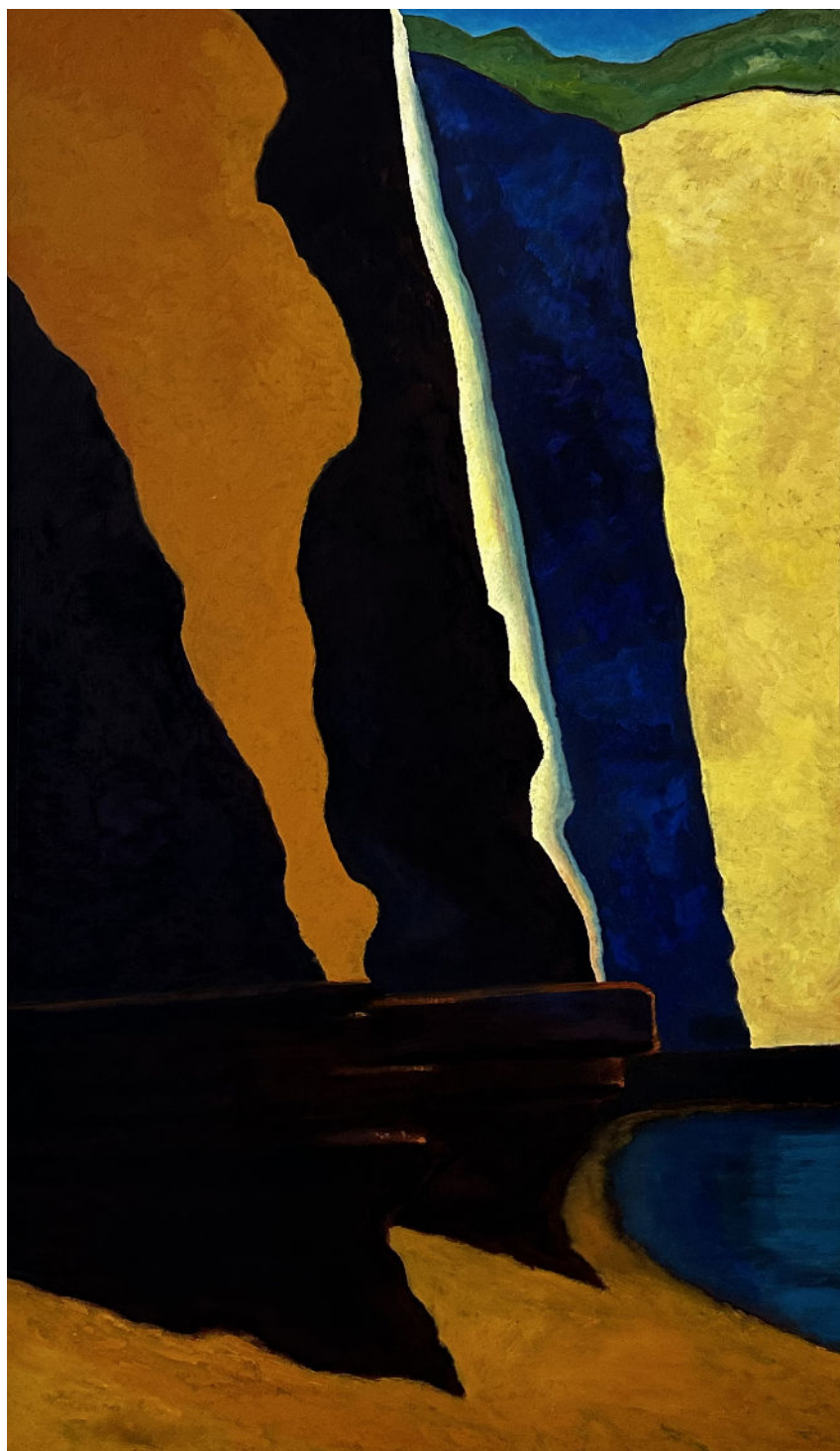
Guy de Malherbe, Fractures, ombres et lumières , huile sur toile, 195 x 97 cm, 2025