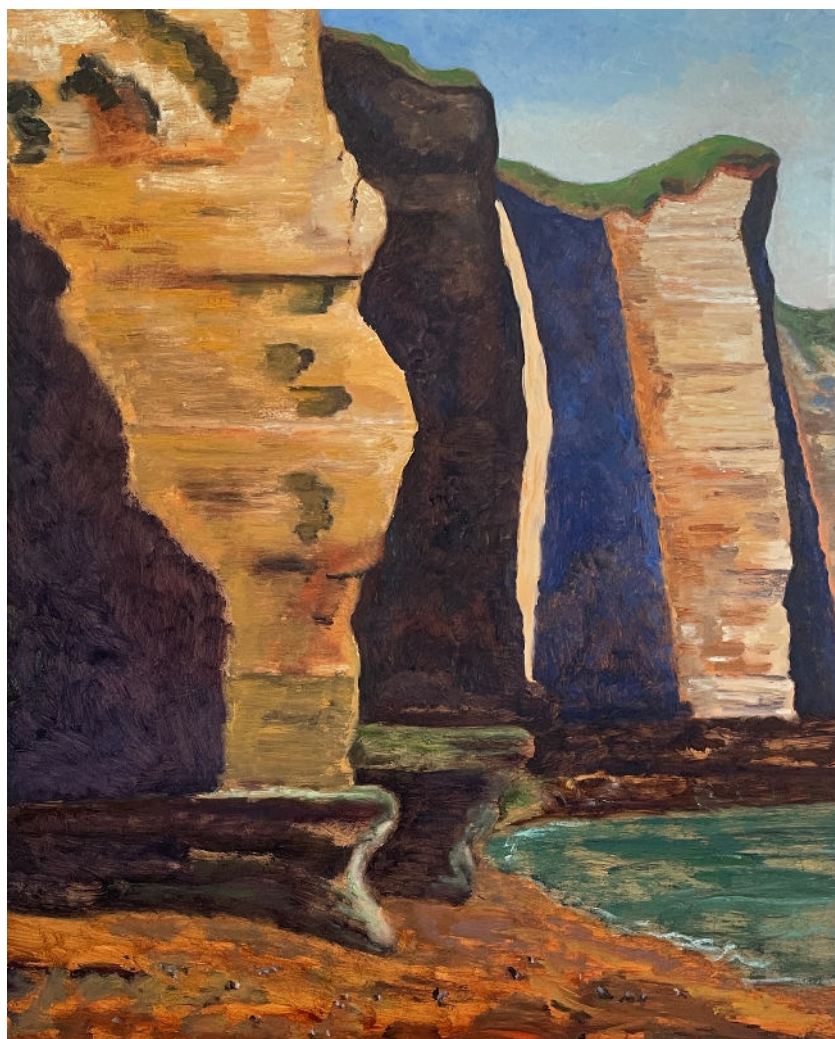
Guy de Malherbe, Falaises , huile sur toile, 89 x 65 cm, 2025