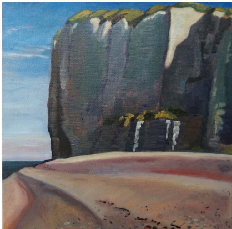
Guy de Malherbe, Falaises, Veule-les-Roses , huile sur toile, 25 x 25 cm, 2021

Guy de Malherbe, Monographie parue chez Skira, 2025