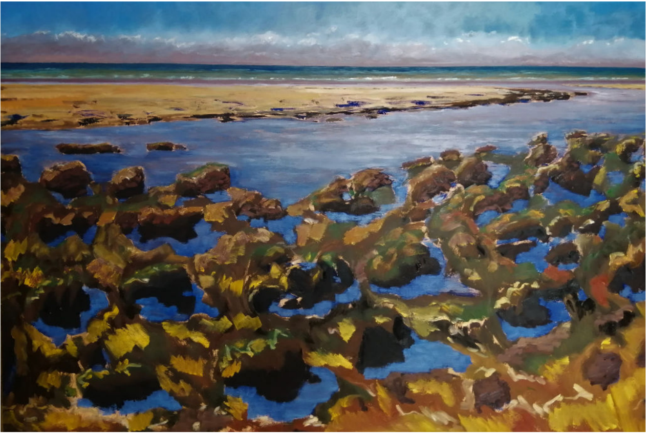
Guy de Malherbe, Marée basse I , huile sur toile, 130 x 195 cm, 2019