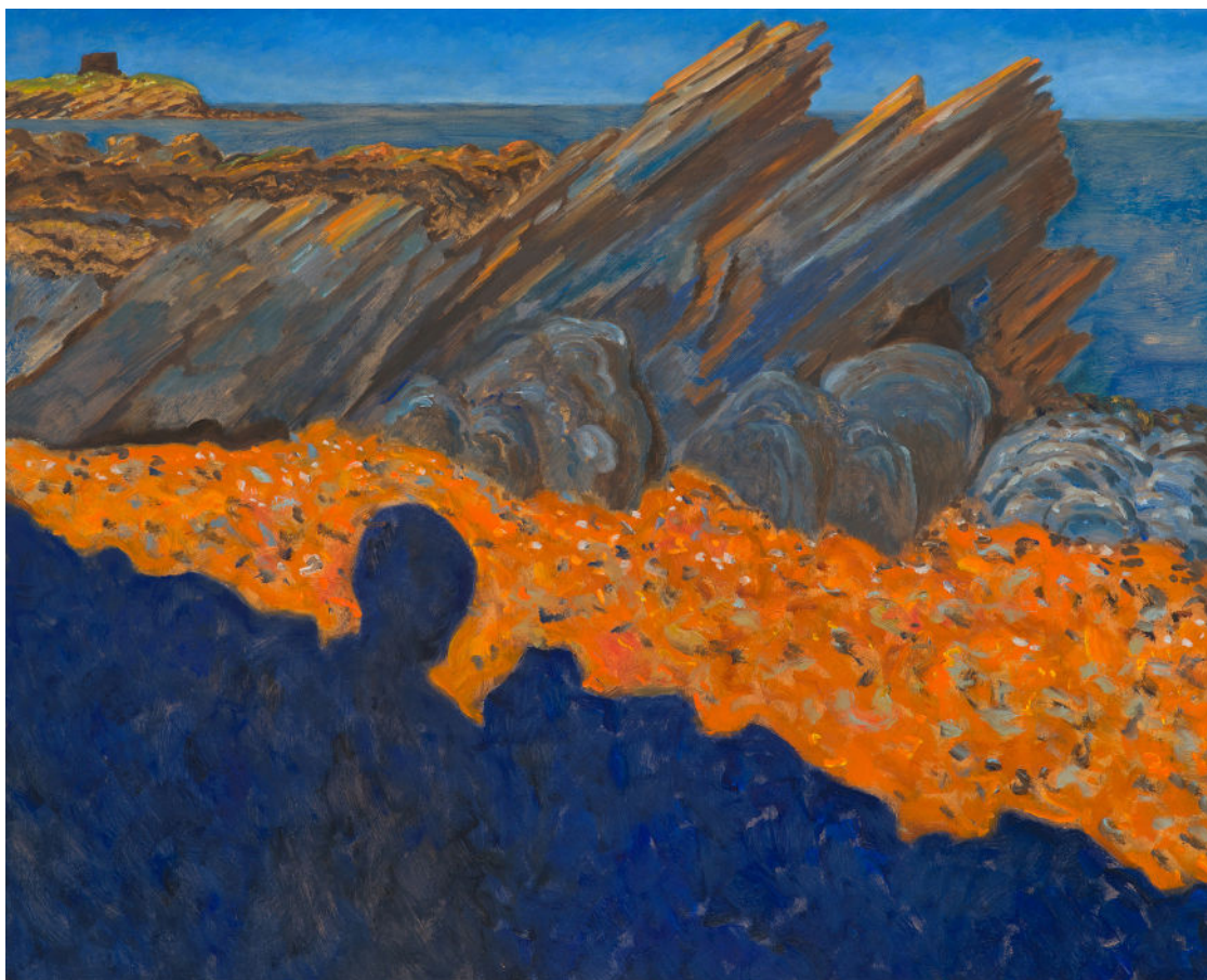
Guy de Malherbe, Rochers et ombre portée (lumière orange) , Cadaqués, huile sur toile, 65 x 81 cm, 2025

Préface du livre de Guy de Malherbe, paru aux éditions Skira