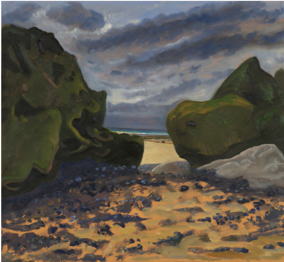
Guy de Malherbe, Sur le motif, Varengeville , huile sur toile, 40 x 40 cm, 2024