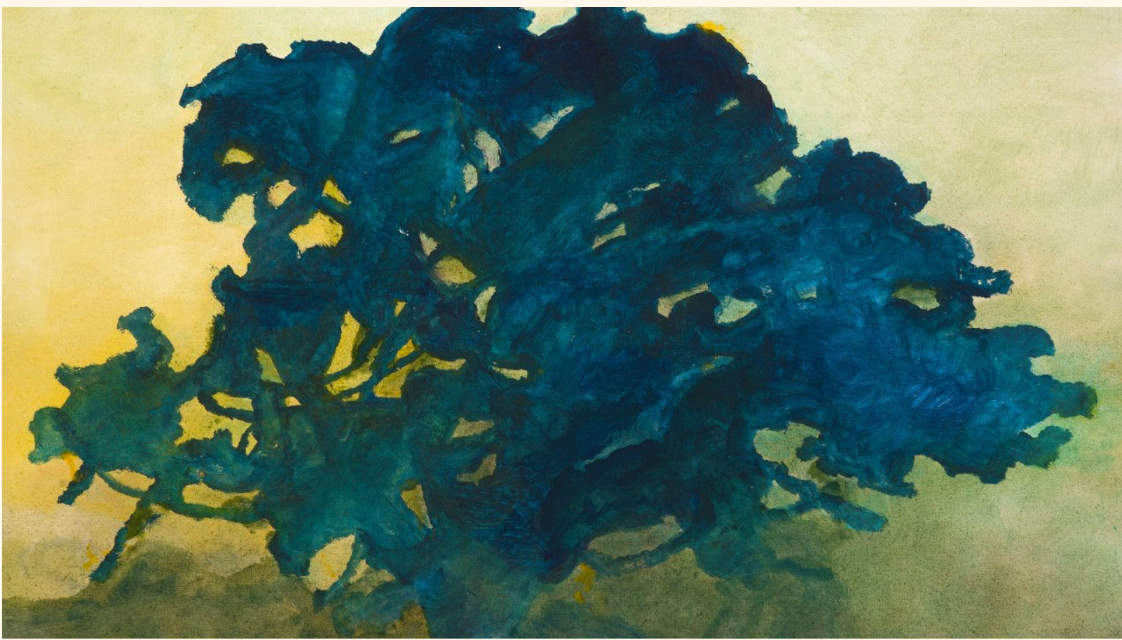
Galerie La Forest Divonne, Alexandre Holand, "Arbre". ©La Forest Divonne