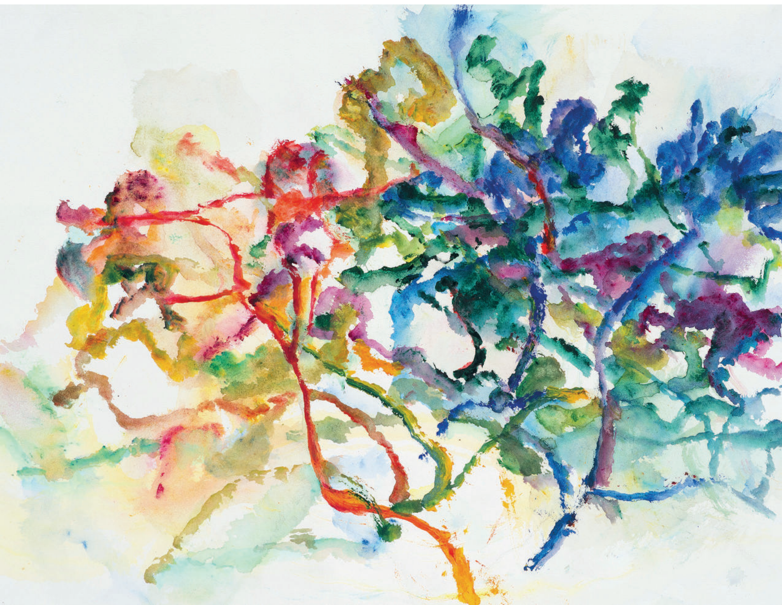
Alexandre Hollan, Le Buisson ardent , 2025, acrylique sur papier, 60 x 80 cm

VERNISSAGE le jeudi 26 février 2026, de 11h à 19h