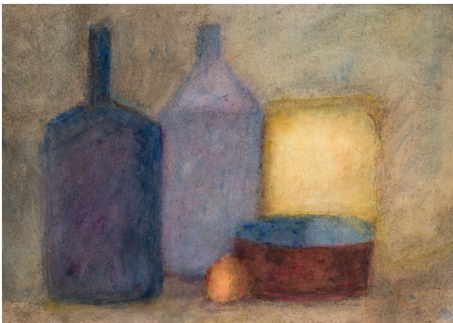
Alexandre Hollan, Vie silencieuse , 2025, acrylique sur papier, 70 x 90 cm

Commissaire d'exposition, écrivain et essayiste