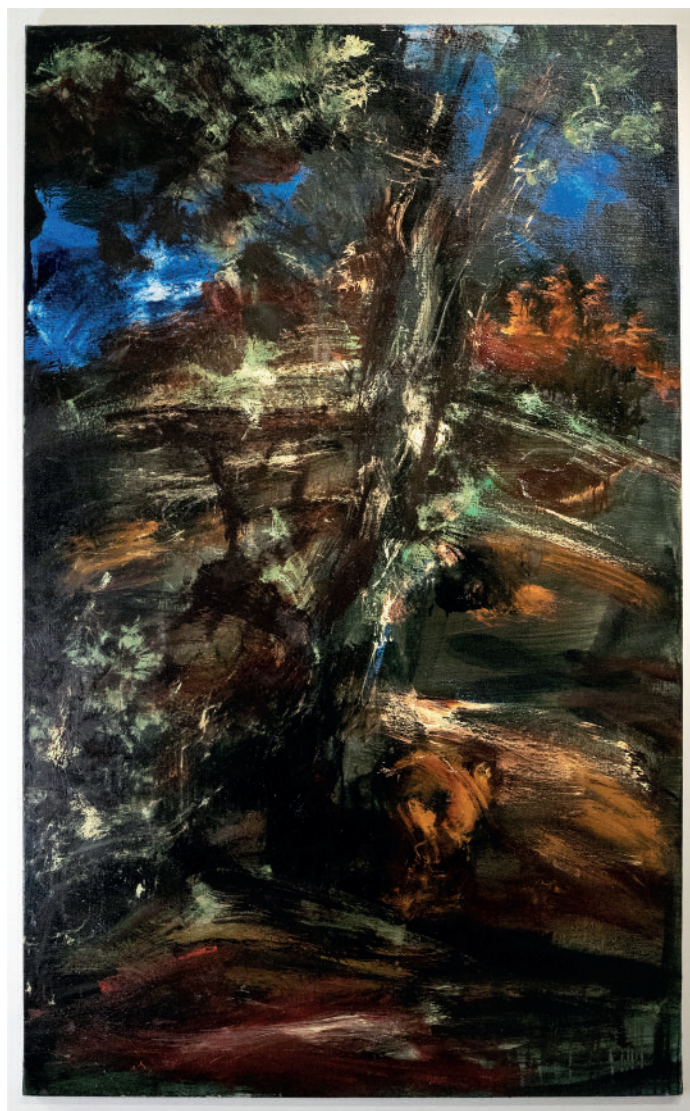
Ronan BARROT, Paysage blessé 2 , Huile sur toile, 162 x 90 cm, 2024

Suite au vif intérêt suscité pour le travail de Ronan Barrot à la foire en 2025, La Galerie La Forest Divonne est heureuse de présenter à nouveau le peintre sur stand avec des œuvres récentes.