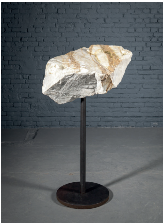
Gerard KUIJPERS, Dancing Stone , White carrara Marble, steel, 115 x 70 cm, 2017

Design Museum Gent, Gand, Belgique Deutsches Architektur Museum, Frankfurt, Allemagne