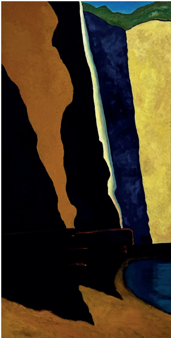
Guy DE MALHERBE, Fracture, ombre et lumière , Huile sur toile, 195 x 97 cm, 2025

Les œuvres de Guy de Malherbe font partie des collections nationales françaises (CNAP, Manufacture Nationale des Gobelins, Ministères des Affaires Étrangères), et de nombreux musées lui ont consacré des expositions personnelles : Musée du Mans, Musée d'Evreux, Musée de Trouville, Abbaye de l'Épau, Chatreuse de Villeneuve-les-Avignon. Son travail a été régulièrement exposé aux États-Unis. L'été 2024, Le Grand Manège de Vendôme lui a organisé une importante exposition monographique, réunissant plus d'une centaine de toiles et une trentaine d'œuvres sur papier.