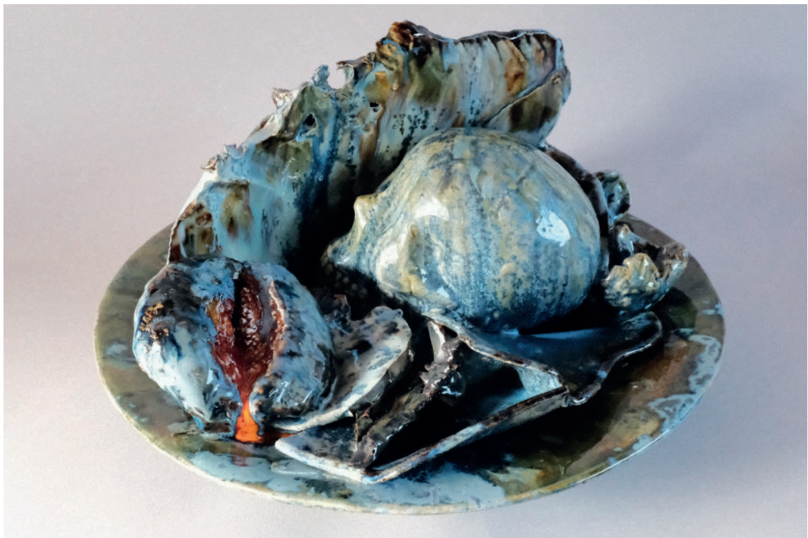
Valérie Delarue, Vanité au fruit , gré émaillé, 28 x 40 x 40 cm, 2023