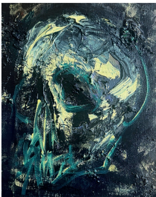
Ronan BARROT, Crâne , Huile sur toile, 27 x 22 cm, 2024