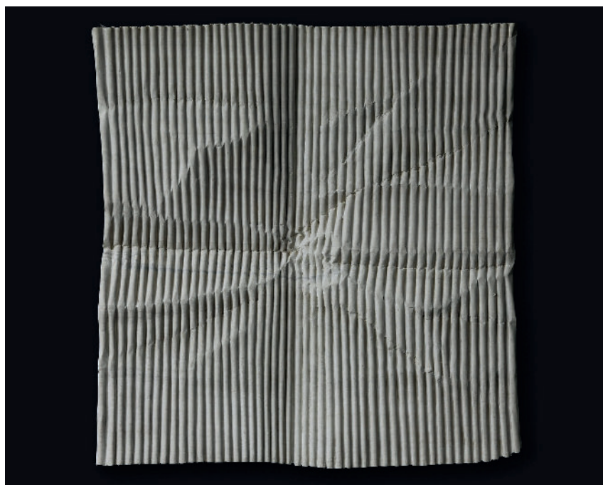
Christian RENONCIAT, Ondé n°5 , quatre plis , tilleul, 54 x 51 cm, 2024