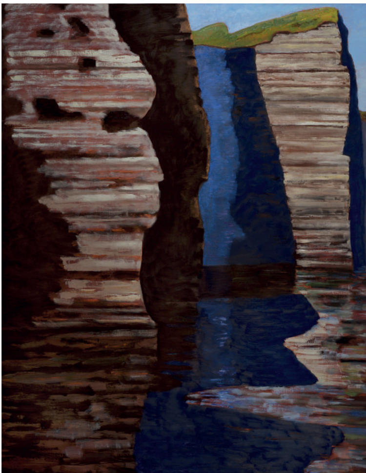
Guy de Malherbe, Falaise 2025, huile sur toile, 162x130cm