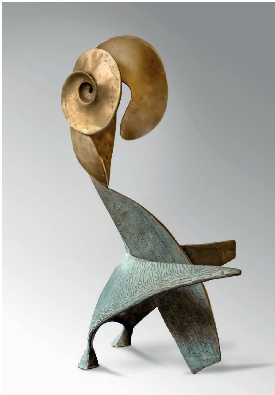
Catherine François, Chimère , bronze, 8 ex. + 4 E.A. , 2024