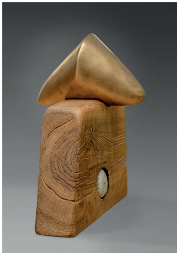
Catherine François, Silex migration , bois et bronze, 2023