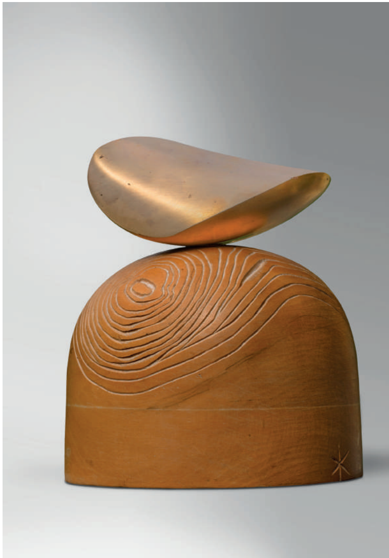
Catherine François, Wave, Bois et bronze, 2023