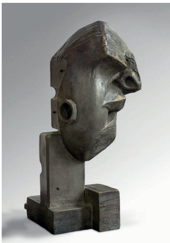
Catherine François, Don Quichotte , bronze, 8 ex. + 4 E.A., 2024