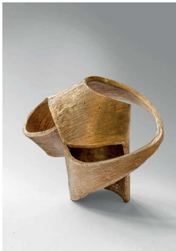
Catherine François, Smile , bronze, 8 ex. + 4 E.A., 2024