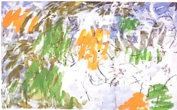
↑ Guy de Malherbe, Enfouie , 2012, huile sur toile, 195 x 130 cm GALERIE LA FOREST DIVONNE, PARIS, BRUXELLES.

GÉRARD GUYOMARD , château de Vascœuil, 02 35 23 62 35, du 27 avril au 27 octobre.