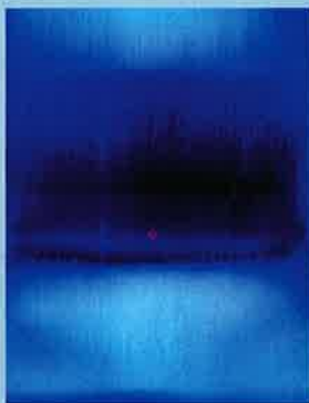
→ Thomas Devaux, Dichroic 3.76 , 2024, verre, impression pigmentaire, 150 x 120 cm GALERIE LA PATINOIRE ROYALE, BRUXELLES. ©T. DEVAUX.