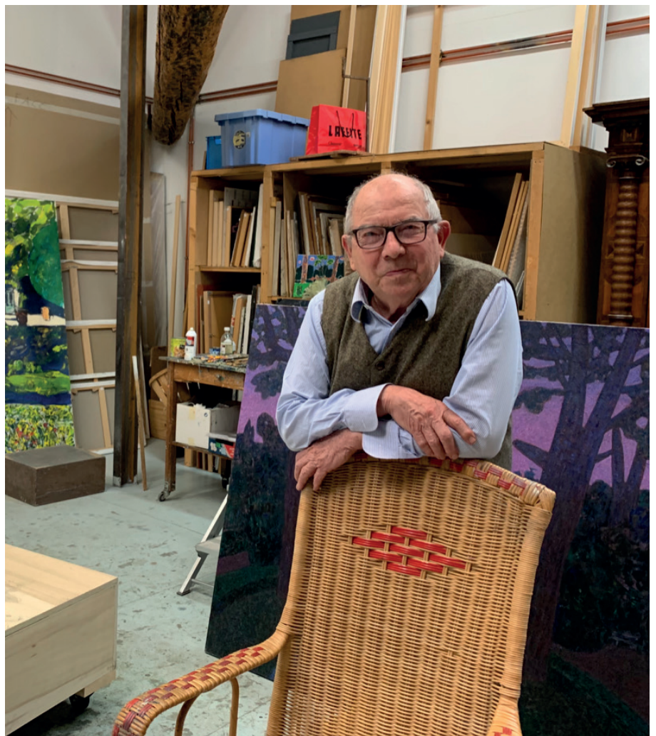
Portrait de Vincent Bioulès

L'importance rétrospective que lui a consacré le Musée Fabre en 2019, avec près de 200 tableaux, a montré l'ampleur de cette oeuvre, depuis les abstractions radicales des années 1960 jusqu'aux toiles les plus récentes, affirmations d'une plénitude et d'une jouissance sans limites de la peinture. La critique le décrit alors volontiers comme le David Hockney français, pour ses couleurs, son inventivité et hédonisme. Depuis le nouvel accrochage des collections d'art contemporain du Centre Pompidou en 2022, le visiteur y est accueilli par une toile monumentale de Vincent Bioulès, hommage du musée à l'importance de l'artiste dans la scène contemporaine.