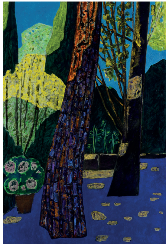
Vincent Bioulès, Le Soir dans le jardin , Huile sur toile, 195 x 130 cm, 2015

Domaine de Chaumont-Sur-Loire 4115 Chaumont-Sur-Loire Tel : 02 54 20 99 22 / Fax : 02 54 20 99 24