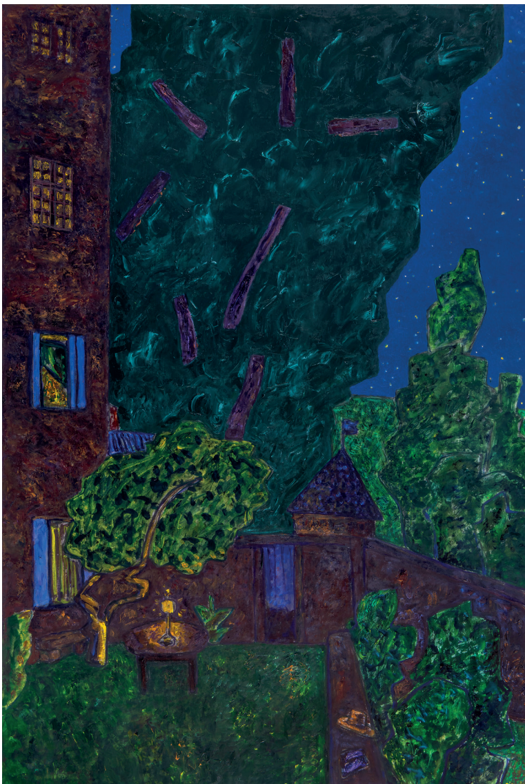
Vincent Bioulès, Nocturne à Laubert II , huile sur toile, 195 x 130 cm, 2023

v.luel@galerielaforestdivonne.com - +32 478 49 95 97