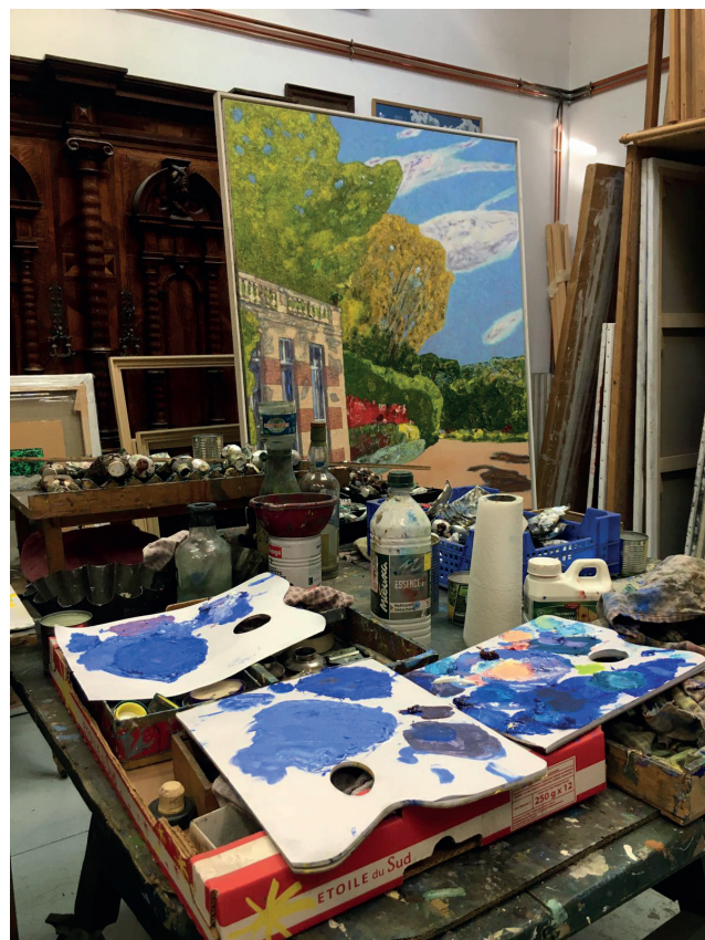
Atelier de Vincent Bioulès

Centre Georges Pompidou, Paris Musée des Beaux-Arts de Caen CAPC, Bordeaux Musée Cantini, Marseille Musée Fabre, Montpellier Musée d'Art Moderne, Céret Musée d'art Moderne et Contemporain de Saint-Etienne Musée de Toulon MAMAC, Nice Musée Picasso, Antibes Musée d'Art Moderne et Contemporain, Strasbourg Musée des Beaux-Arts de Strasbourg