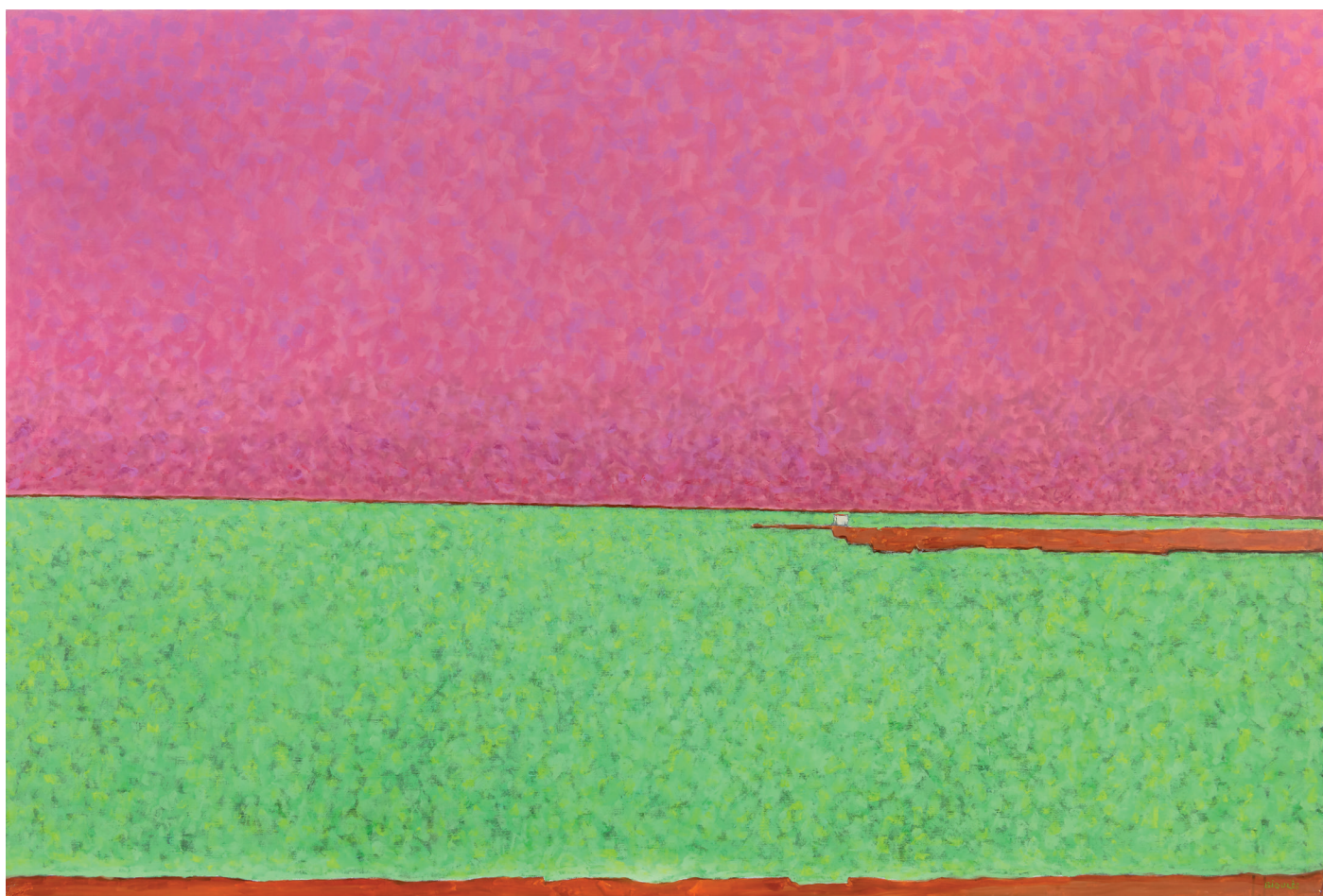
Vincent Bioulès, L'Étang de l'Or ou le grand soir , Huile sur toile, 130 x 195 cm, 2023