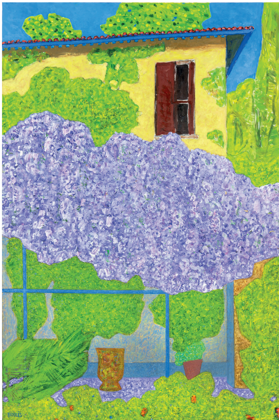
Vincent Bioulès, La Glycine , Huile sur toile, 195 x 130 cm, 2023