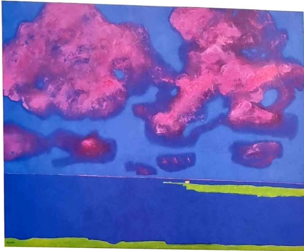
Vincent Bioulès (né en 1938), 19h45.07.23 II, 2023, huile sur toile, 130 x 162 cm.

« L'urbanisme a tout changé. Mais la lumière est restée immuable et peut même sublimer, à certaines heures de la journée, ce nouveau paysage. »