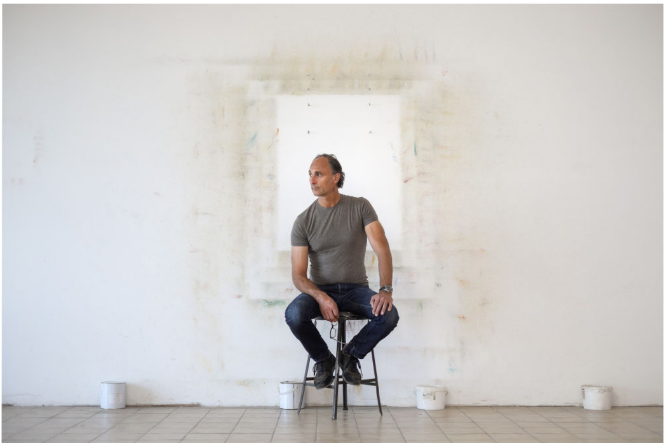
Jeff Kowatch