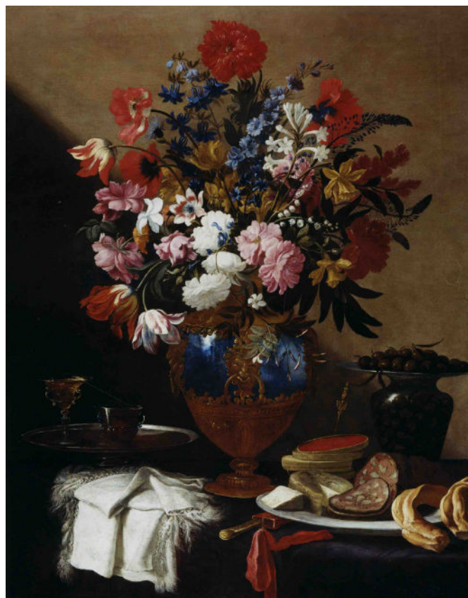
Pier Francesco Cittadini, Bouquet de fleurs dans un vase, plateau de fromages, charcuterie et verres de vin , Huile sur toile, 125 x 100 cm, circa 1660