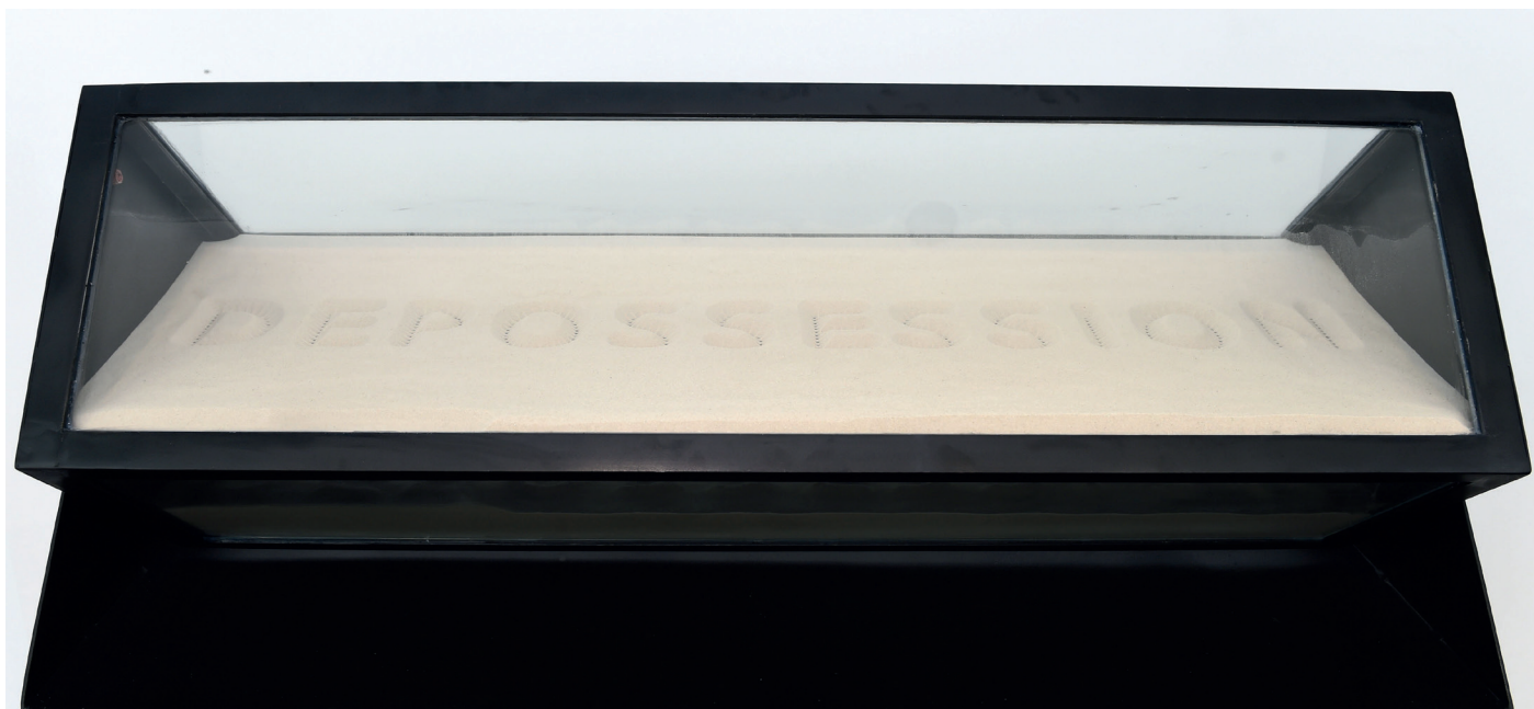
Jean-Bernard Métais, Être-Mot, Depossession , metaal, glas en zand, 130 x 118 x 45 cm, 2016