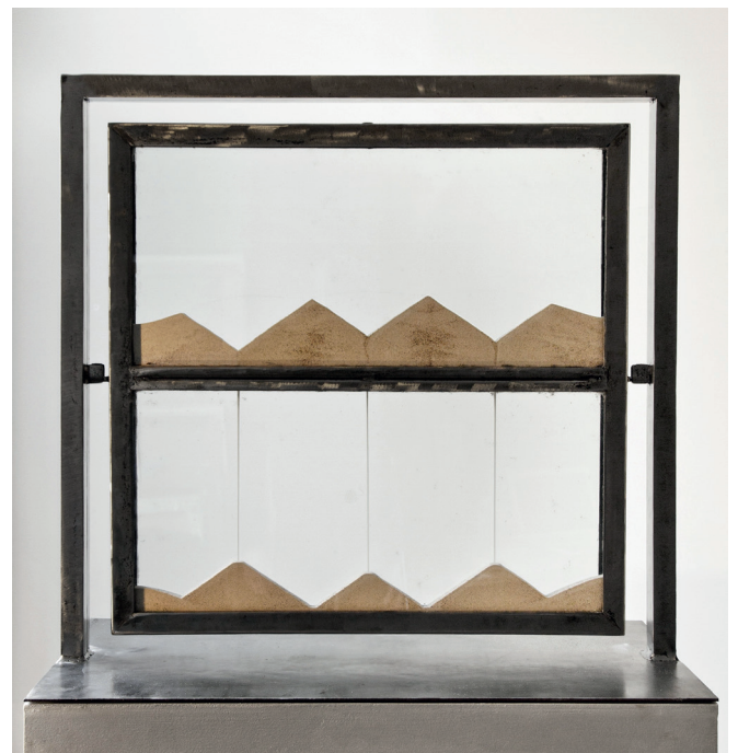
Jean-Bernard Métais, Sablier irrévérissable 3 trous , staal, glas en zand, 73 x 36 x 68 cm, 2014