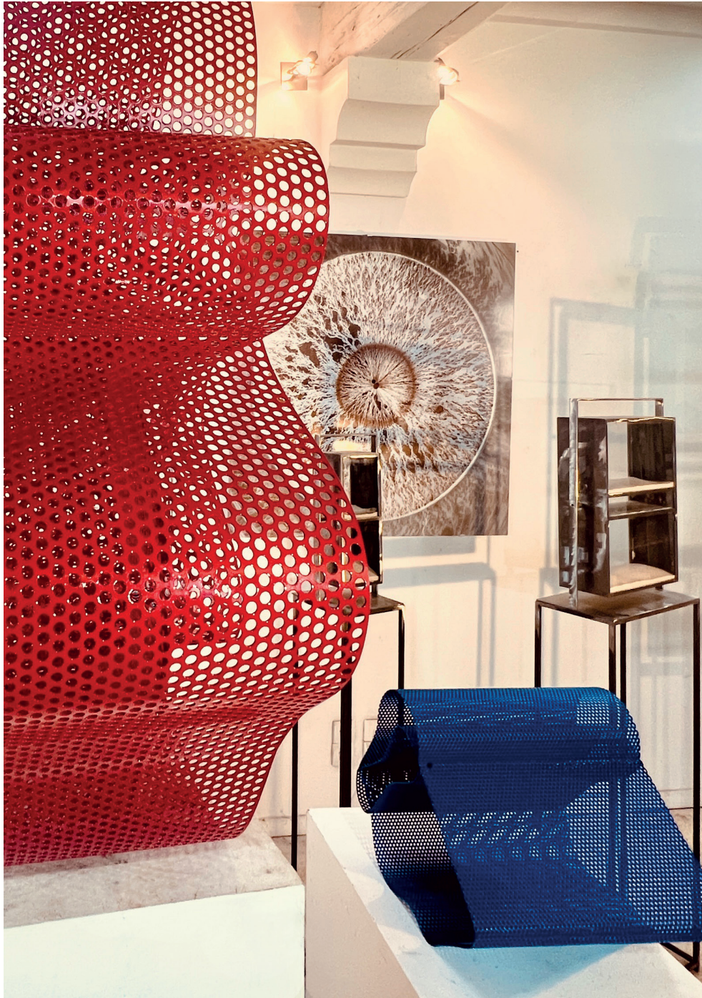
Gezicht op het atelier van Jean-Bernard Métais, februari 2024

VERNISSAGE donderdag 14 maart 17.00 - 21.00 uur