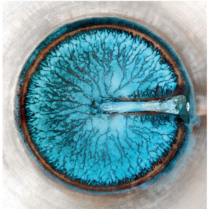
Jean-Bernard Métais, Le Cuvier de Jasnières 3/6 , Print gemonteerd op aluminium, 120 x 120 cm, 1976