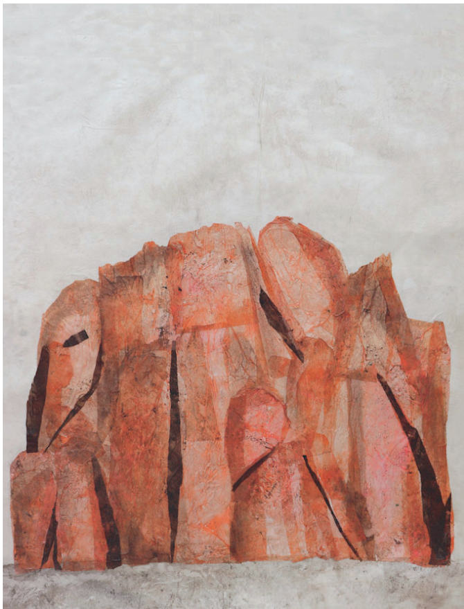
Valérie Novello, Recoller Montagne rose , Papier japonais, gouache, H 120 x L 96 cm, 2019