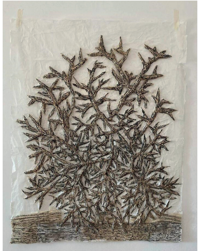
Valérie Novello, Epines , Papier du Japon, Pastel, verre, 94 x 119 cm, 2021