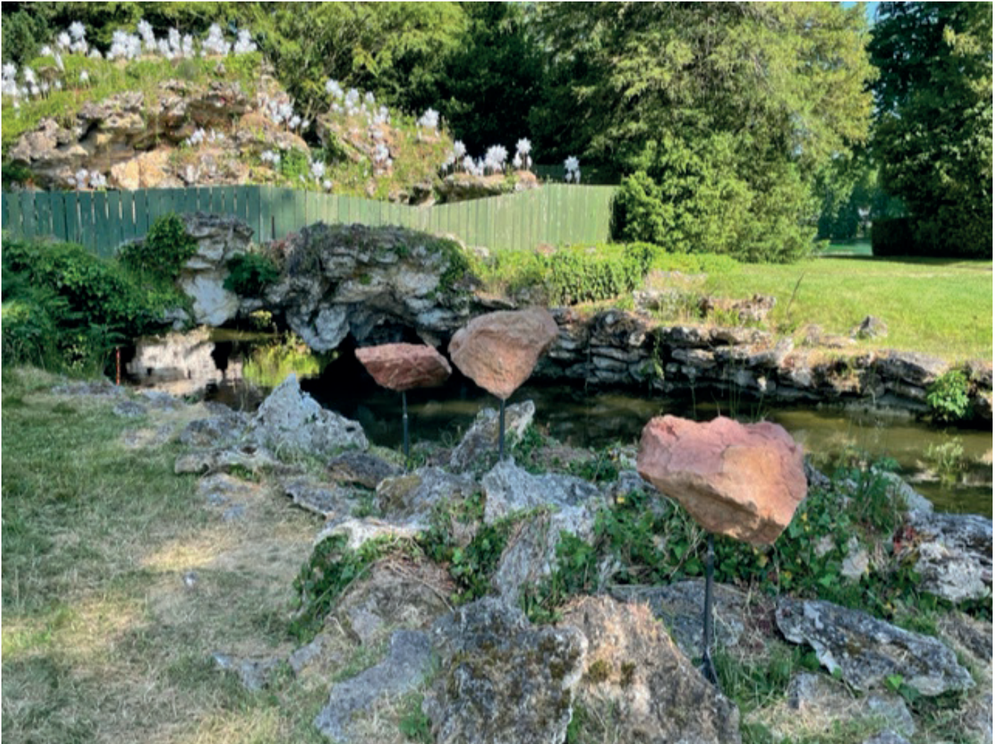
Gerard Kuijpers, Group of 3 stones from South Pyrenees, at exhibition Grandeur Nature , Château de Fontainebleau

Design Museum Gent, Gand, Belgique Deutsches Architektur Museum, Francfort, Allemagne