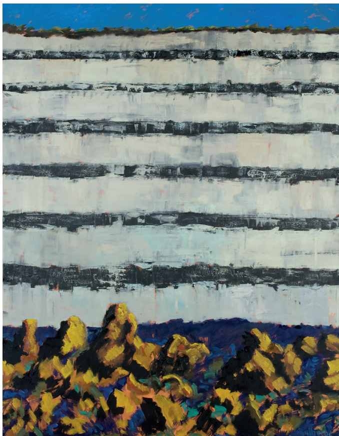
Guy de Malherbe, Falaise , Huile sur toile, 250 x 195 cm, 2013