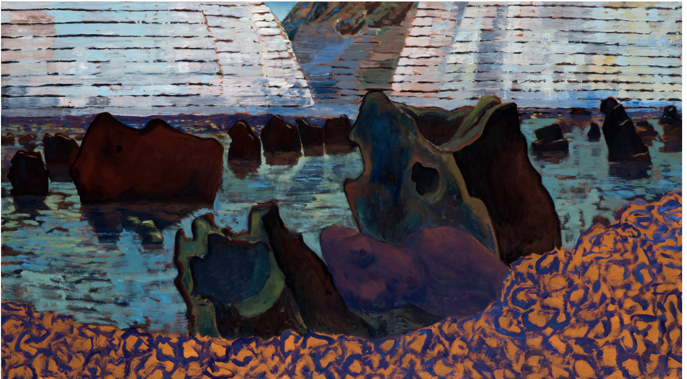
Guy de Malherbe, Pierres d'attente , Huile sur toile, 100 x 180 cm, 2022

Le Grand Manège, à Vendôme, prépare une grande rétrospective de son œuvre pour l'été 2024.