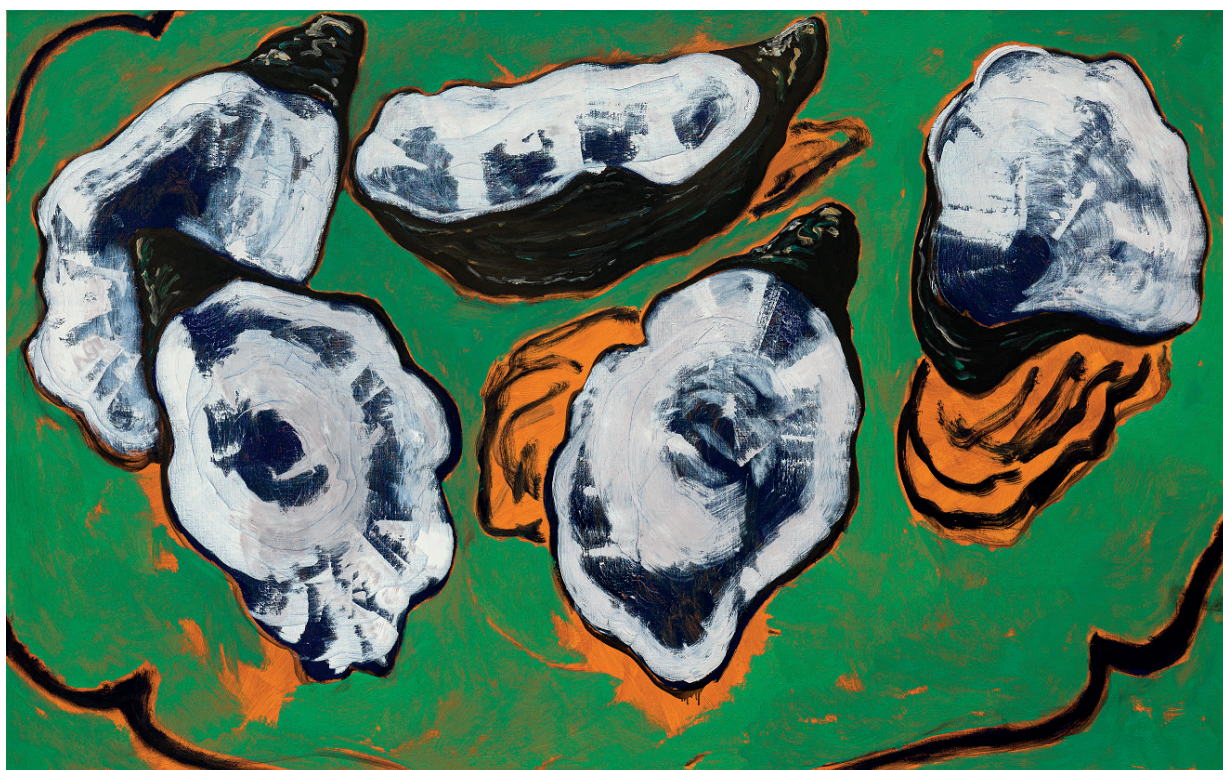
Guy de Malherbe, Cinq huîtres fond vert, orange et arabesque noir , huile sur toile, 99,5 x 159 cm, 2020