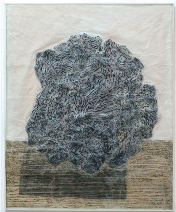
Valérie Novello, Boule , Papier du japon, pastel sec, 120 x 93 cm, 2021