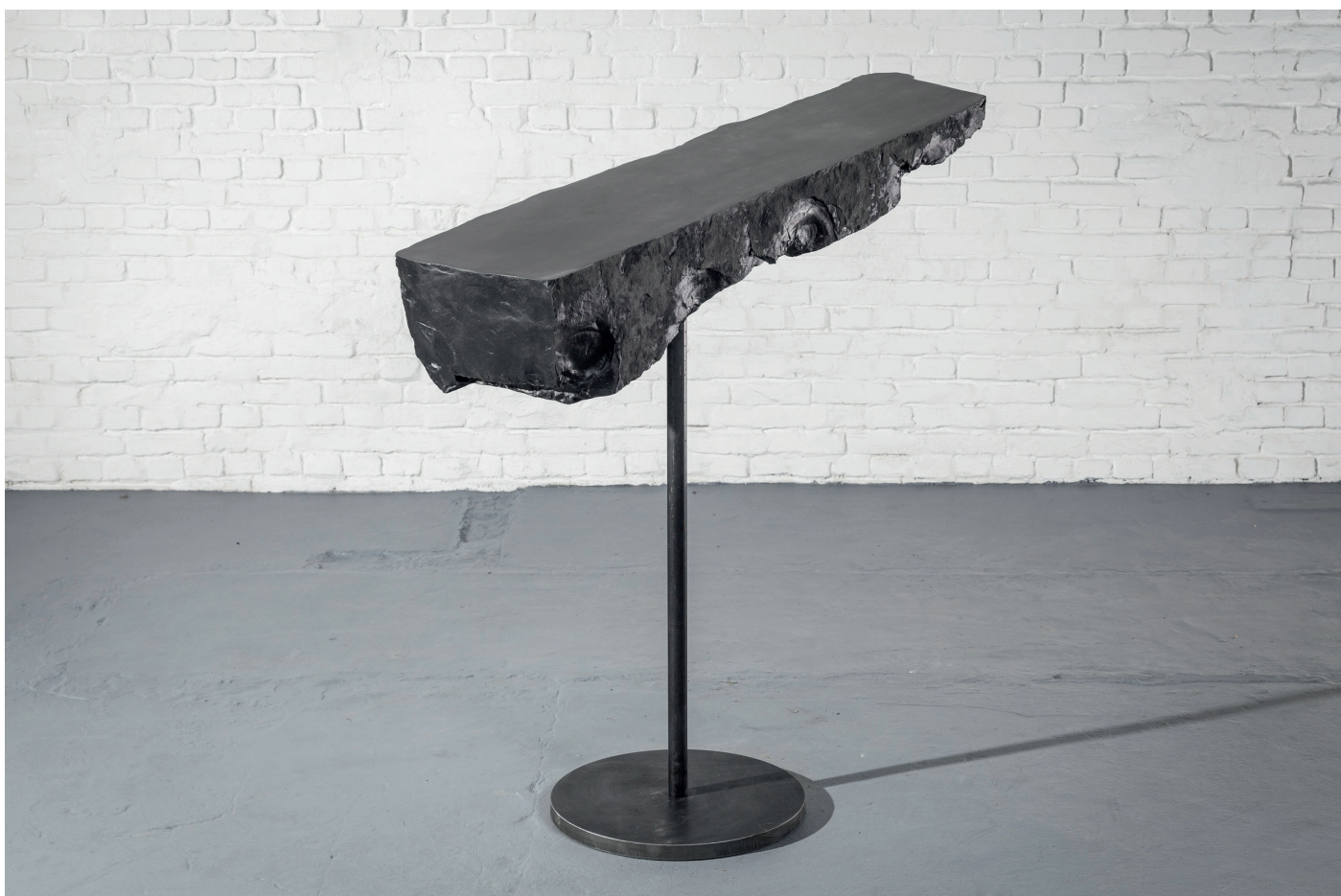
Gerard Kuijpers, Dancing Stone , Mazy black marble, 110 x 130 cm, 2024

Le travail de Kuijpers, un temps représenté par la Galerie Gastou à Paris, a fait partie de projets majeurs en France, en Italie, au Japon et aux États-Unis. Plus récemment avec le Musée de la Chasse et de la Nature au Château de Fontainebleau, à l'été 2023, et à Milan, sous la superbe verrière de la Galleria Vittorio Emmanuelle II. La Forest Divonne est fière d'exposer ses œuvres à Art Brussels 2024 après une première exposition à la BRAFA 2024.