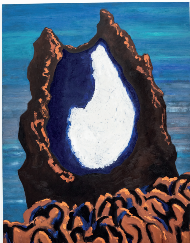
Guy de Malherbe, Sans titre , Huile sur toile, 146 x 114 cm, 2023