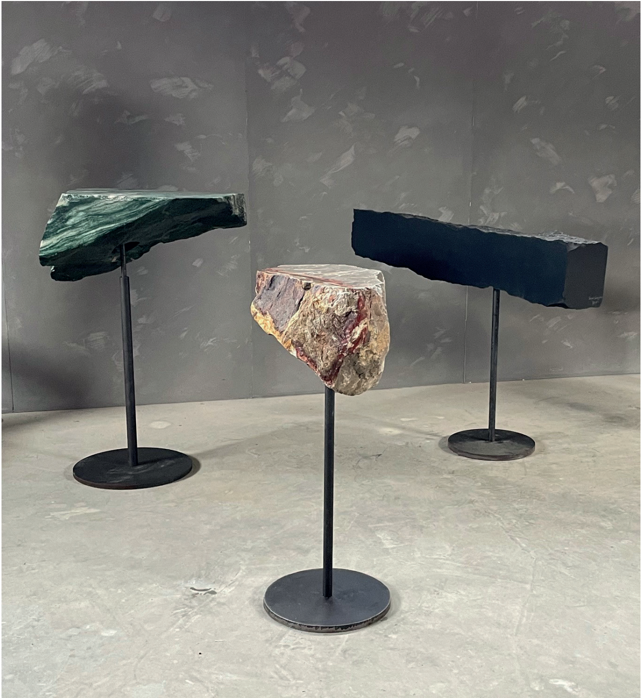
Gerard Kuijpers, Dancing Stones , Marble, steel