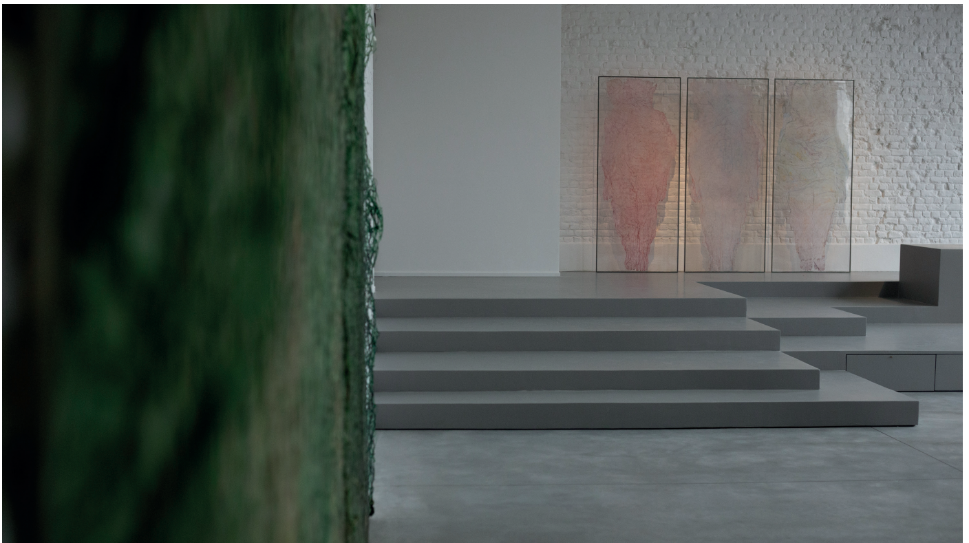
Valérie Novello Peaux et Recouvrement

Lien d'inscription : https://www.eventbrite.com/e/inner-lands-scapes-tickets-851541021117?aff=oddtcreator