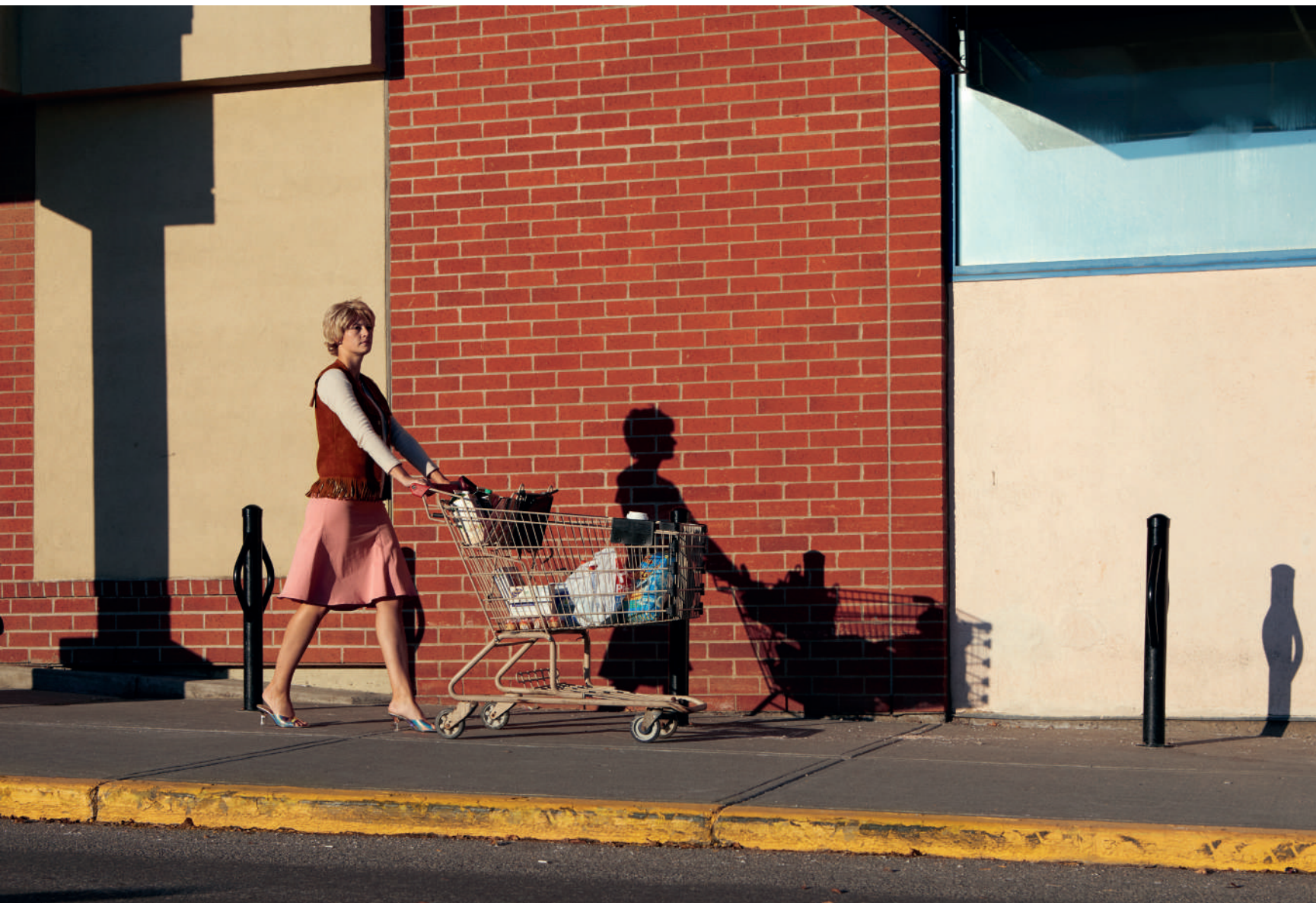
The Safe Way «Beyond the Shadows» 1/5 2018 Impression Jet d'Encre Semi-Mate Sur Papier Baryté Ed. 5ex + 2 EA H 80 x L 120 cm