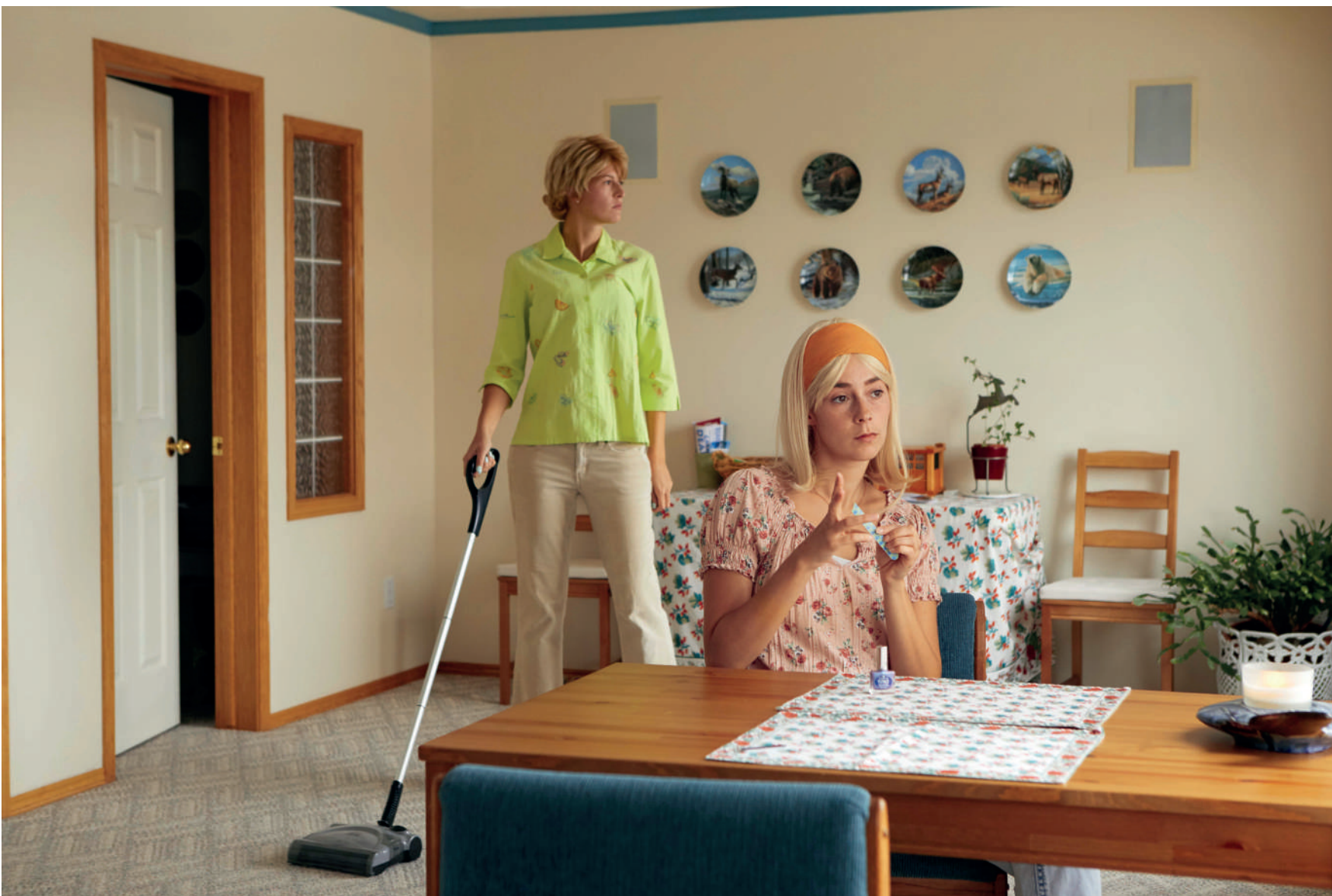
Cochrane, « Beyond the Shadows » 1/5 2018 Impression jet d'encre semi-mate sur papier baryté ED 5ex + 2EA H 80 x L 120 cm