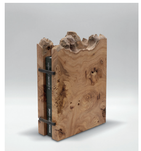
Luxe Edition Monograph

This book gives an account of thirty-five years of artistic work, initiated in the 1980s with tapestry, and which, thereafter, through different stages where the material and the gesture are primordial, asserts itself resolutely towards sculpture. It approaches the work through materials and gestures. Sheets, blotters, paper, newspapers, bamboo, pine needles, wicker... and now metal unfold a succession of chapters that the artist approaches with the same curiosity, the same simplicity and the same necessity. In this spirit, the texts have been chosen among those of authors who have marked certain exhibitions or decisive stages in the artist's career.