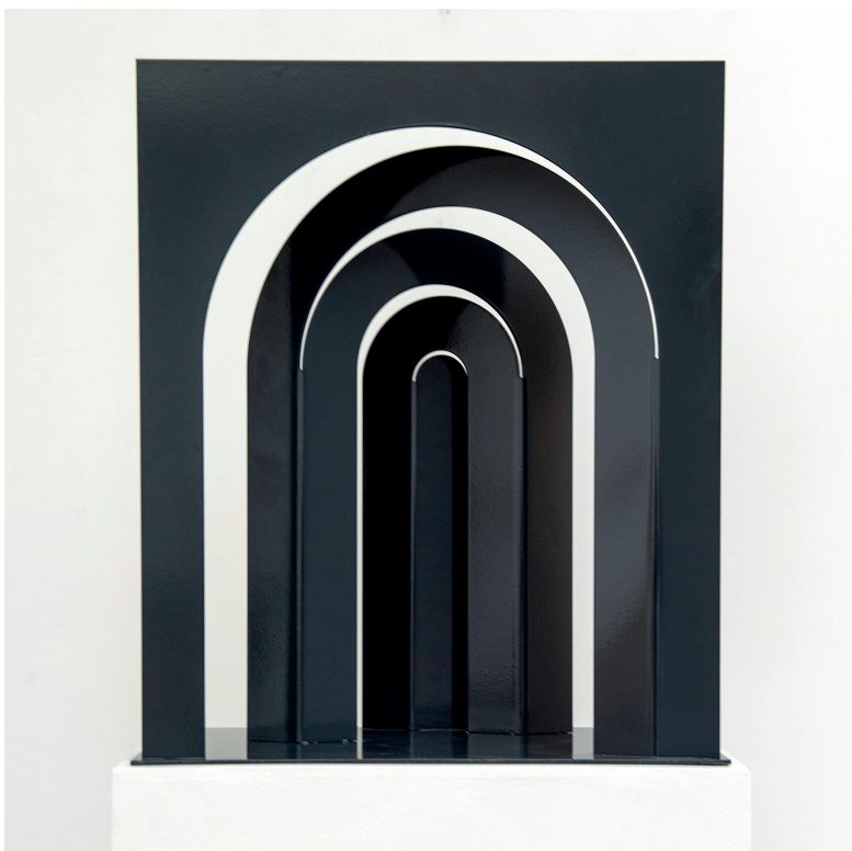
Bernadette Chéné, Dans la perspective 1/3 , painted metal, 60 x 50 x 25 cm, 2018

Carried by the heritage of Minimalism and Arte Povera, Bernadette Chéné uses simple materials to exploit their formidable plastic qualities. She resolutely leaves the ornament at a distance in order to favor the listening, the subtle perception.