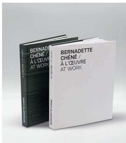
Monograph with original drawing