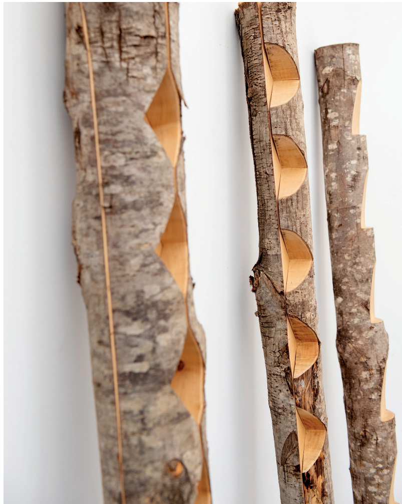
Bernadette Chéné, Coches , bois (Chataigner), 204 x 13 x 13 cm, 2022

Didier Arnaudet parle à propos des œuvres de Bernadette Chéné d'une « nudité complexe ». Tandis qu'elle met les matières à nu, comme ces bois dont elle ôte l'écorce, Chéné nous plonge dans une émotion simple, géométrique, tactile, silencieuse, qui nous rapproche de notre nature profonde, sans artifice.