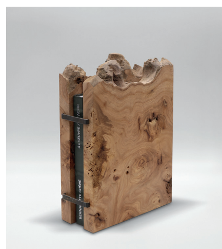
Monographie luxe édition

Cet ouvrage rend compte de trente-cinq années de travail artistique, initié dans les années 1980 avec la tapisserie, et qui, par la suite, à travers différentes étapes où la matière et le geste sont primordiaux, s'affirme résolument vers la sculpture. Il aborde l'oeuvre par le biais des matériaux et des gestes. Draps, buvards, papier, journaux, bambou, aiguilles de pin, osier... et désormais métal déroulent une succession de chapitres que l'artiste aborde avec la même curiosité, la même simplicité et la même nécessité. Dans cet esprit, les textes ont été choisis parmi des textes d'auteurs qui ont jalonné certaines expositions ou des étapes décisives du parcours de l'artiste.