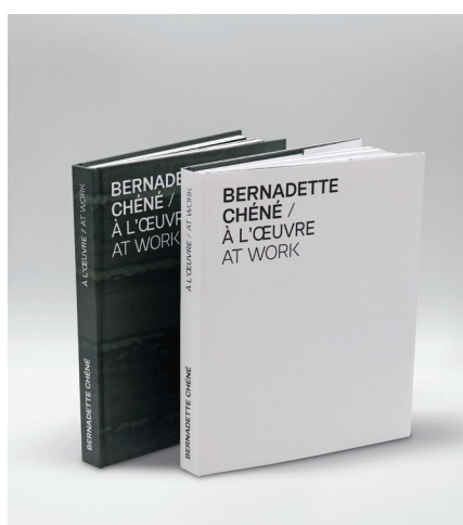
Monographie avec dessin original