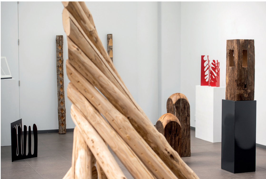
Bernadette Chéné, «L'Un et l'autre», vue d'exposition, 2022

Website : https://www.galerielaforestdivonne.com/fr/accueil/ Instagram : https://www.instagram.com/galerielaforestdivonne/ Facebook : https://www.facebook.com/Laforestdivonnebrussels/