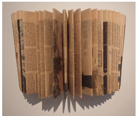
Bernadette Chéné, Information vertical , Papier journal, 16 x 24 x 14 cm, 2017