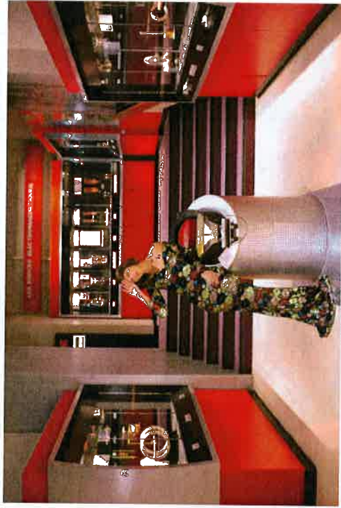
Palace Odyssée © Elsa &amp; Johanna

Elsa & Johanna procèdent toujours à une longue immersion, « des semaines d'investigations », dans l'univers qui sert de théâtre à leurs mises en scène. Elles dissèquent chaque détail des décors. Même les couleurs et la lumière influencent les personnages fictifs, de tous genres et de tous âges, qui vont peupler leurs photos. « Ces derniers tirent leur inspiration de l'imaginaire collectif, du Palais de la découverte en lui-même », précisent-elles.