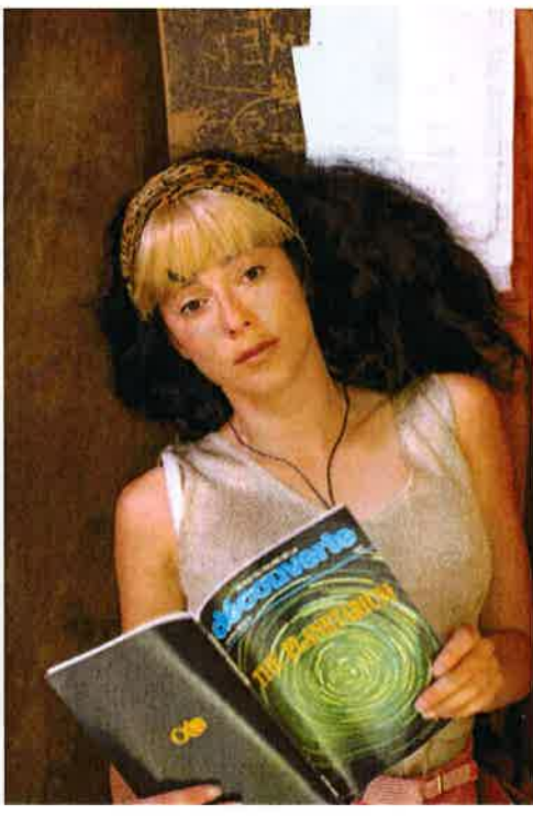
Palace Odyssee

science-fiction vintage, à l'univers du manga, et à [leur] propre vision du monde scientifique ». Or l'aura fantastique et l'étrangeté des interactions nous feraient presque oublier que ce sont de véritables expériences scientifiques qui sont illustrées.