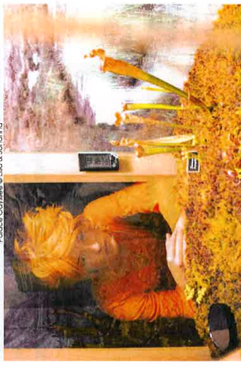
Palace Odyssee © Elsa &amp; Johanna

Telles que l'électrokinésie (qui avait particulièrement