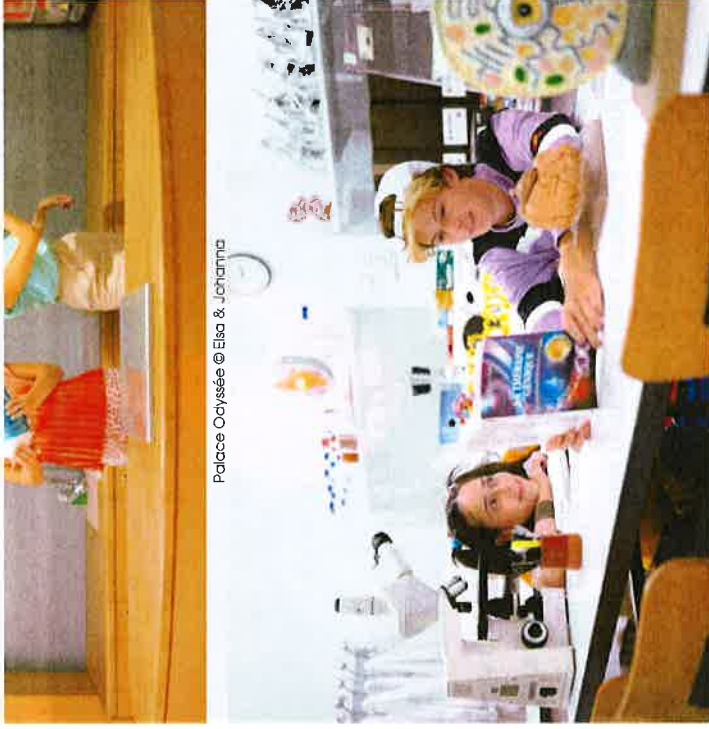
Palace Odyssee