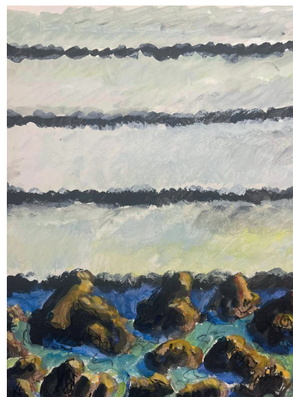
Guy de Malherbe, Sans titre , technique mixte sur papier, 30 x 22 cm, 2014