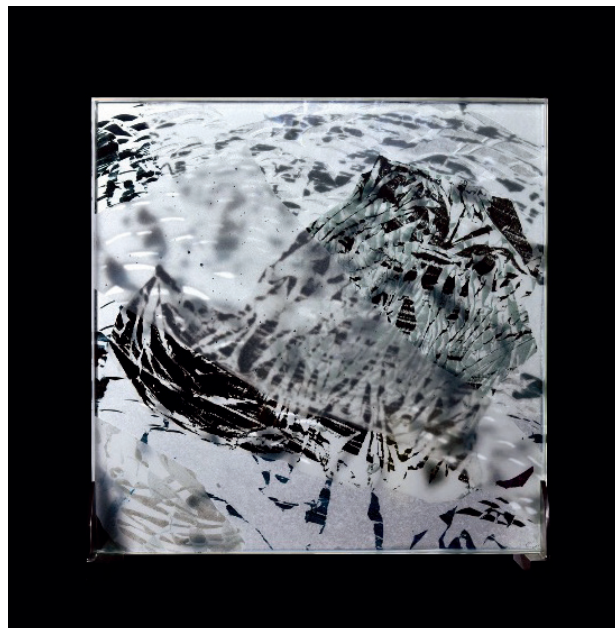
Caribaï, Clairvoie VI , Encre sur papier du japon, plaques de verre feuilletés, pied en acier, 50 x 50 x 3,5 cm, 2022

Montagne-eau et vent-lumière, c'est ainsi que la langue chinoise nomme le paysage. Deux couples complémentaires, qui se fondent sur le mouvement et le vide pour dire une nature vivante dans laquelle l'artiste s'intègre plus qu'il ne la décrit. Caribaï, artiste franco-vénézuelienne, née à Tokyo et vit à Bruxelles. L'influence de l'Asie est très forte dans son travail, tant dans son approche de la création que dans les matériaux qu'elle utilise, le papier japonais, en particulier. La galerie La Forest Divonne fait le focus sur l'œuvre de cette jeune artiste qui s'est approprié la tradition asiatique pour en donner une pratique personnelle et contemporaine, tant par le rendu que par la technique. L'impressionnante exposition que lui a consacré le Musée des Arts Asiatiques de Nice en 2021, a donné la mesure de cette œuvre, puissante, ambitieuse, riche, autour d'un magistral polyptique de plus de 30m de long, installé dans la grande rotonde du musée tel des Nymphéas contemporains et complétée par une installation immersive de papiers flottants et de papiers sous verre, traversés de lumière, comme les parois des maisons traditionnelles japonaises. Le stand d'Art on Paper rendra compte tant de ses papiers marouflés sur bois que de ses papiers sous verre.