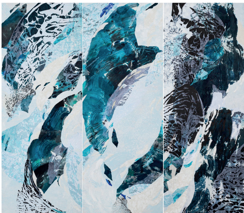
Caribaï Migeot, L'Empreinte du vent VI , collage gravure et peinture sur trois panneaux de bois, H 185 x L 222 cm, 2020