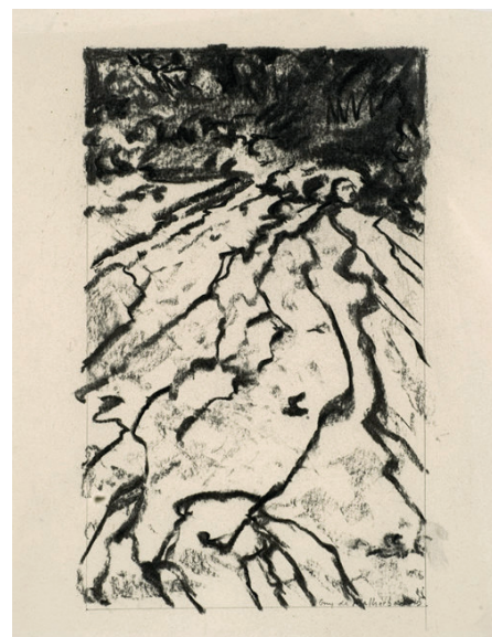
Guy de Malherbe, Sans titre , technique mixte sur papier, 30 x 22 cm, 2014

Le Grand Manège, à Vendôme, lui prépare une importante rétrospective pour l'été 2024.