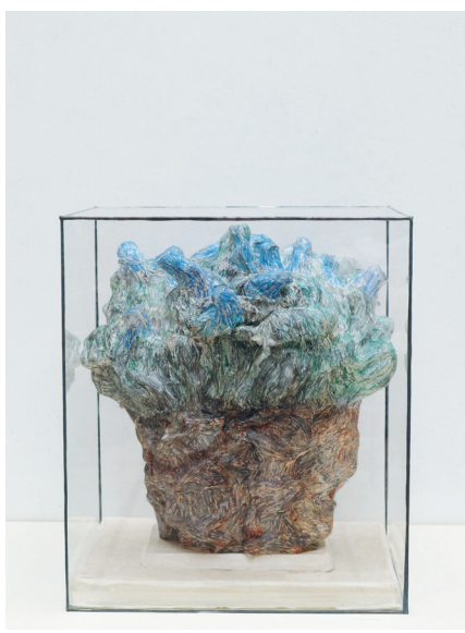
Valérie Novello, Oiseaux de jour , Papier japonais, gouache, cloche en verre, 59 x 42 x 42 cm, 2022