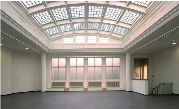
Galerie La Forest Divonne Bruxelles Une verrière Art Deco exceptionnelle dans le quartier créatif et branché de Saint-Gilles