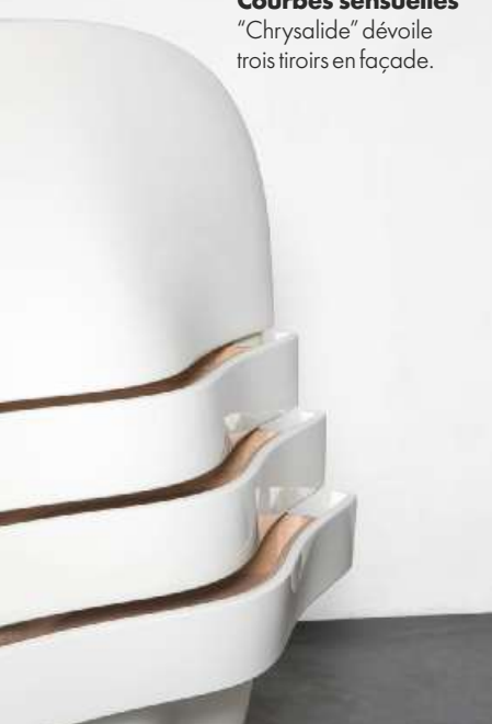
Courbes sensuelles "Chrysalide" dévoile trois tiroirs en façade.