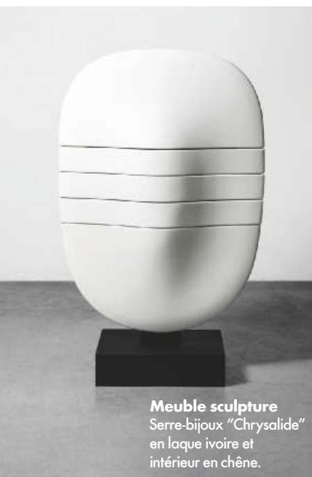
Meuble sculpture Serre-bijoux "Chrysalide" en laque ivoire et intérieur en chêne.