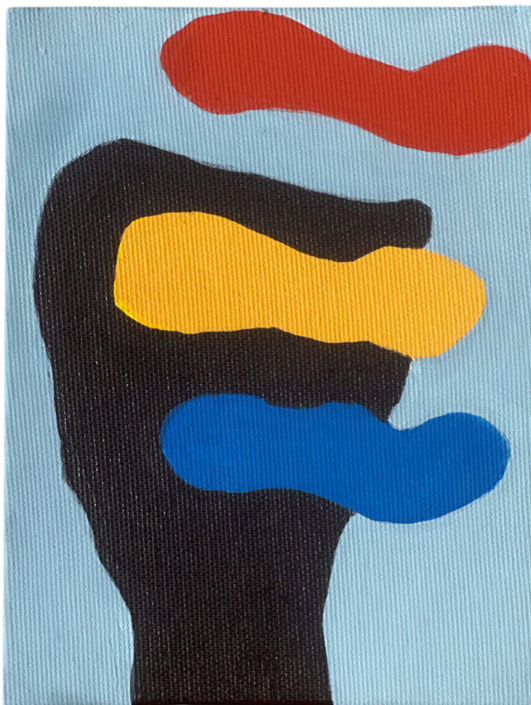
Alain Veinstein, Sans titre , acrylique sur toile, 20 x 15 cm, 2023

Un dimanche à la galerie Dimanche 15 octobre de 14h à 18h