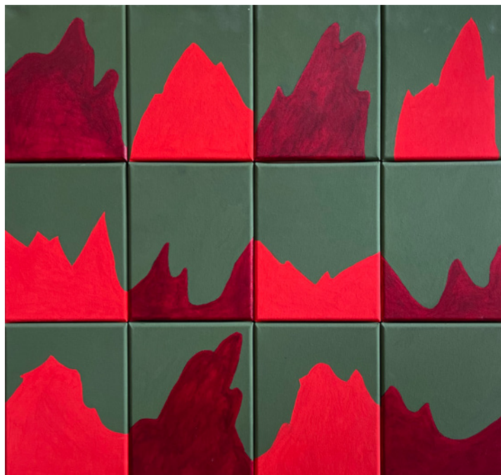
Alain Veinstein, Sans titre , acrylique sur toile, 60 x 60 cm, 2023

Depuis 2015, il se plonge dans la peinture et expose régulièrement.