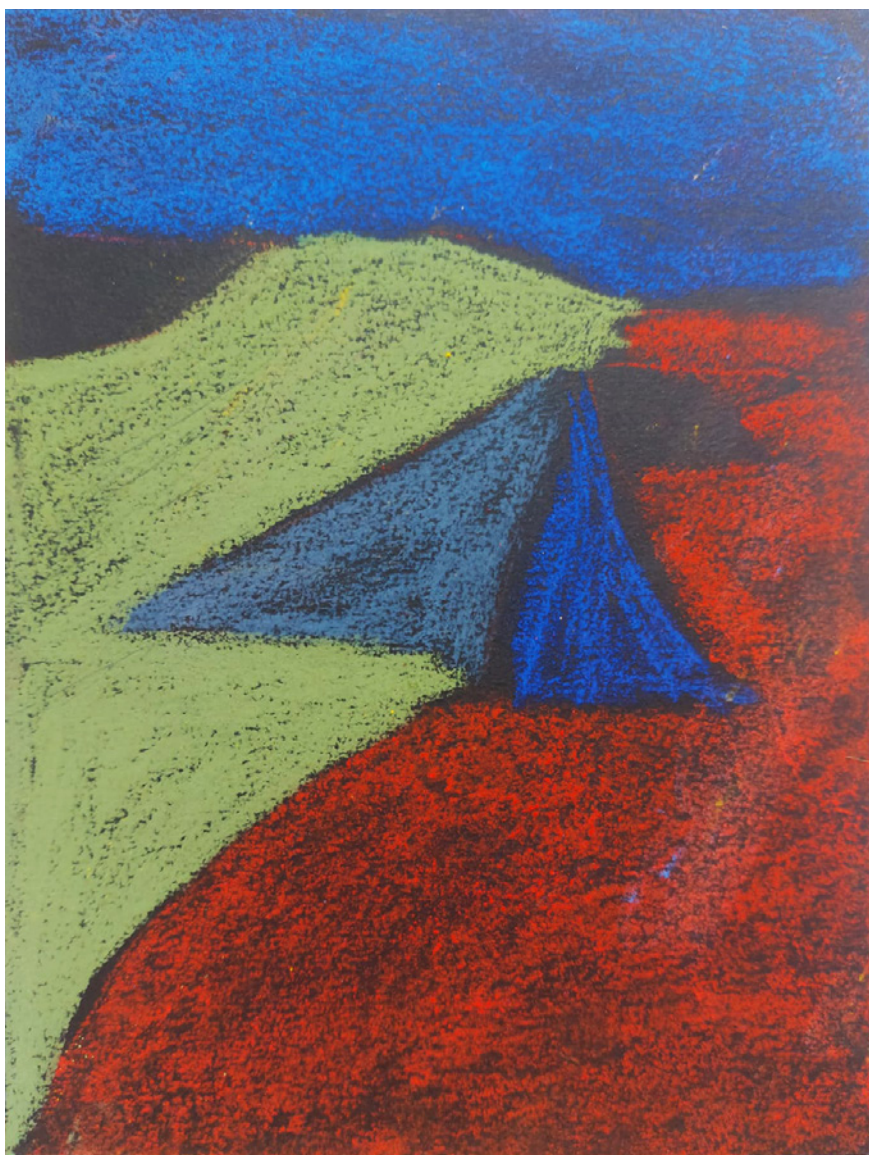
Alain Veinstein, Sans titre , pastel sur papier, 20x 15 cm, 2023