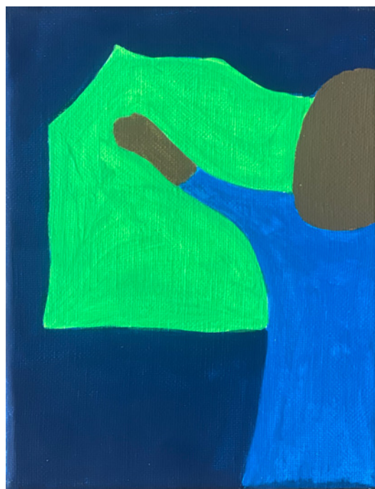
Alain Veinstein, Sans titre , acrylique sur toile, 20 x 15 cm, 2023

Galerie La Forest Divonne 12, rue des Beaux-Arts - 75006 Paris mardi - samedi 11h-19h +33 (0)1 40 29 97 52