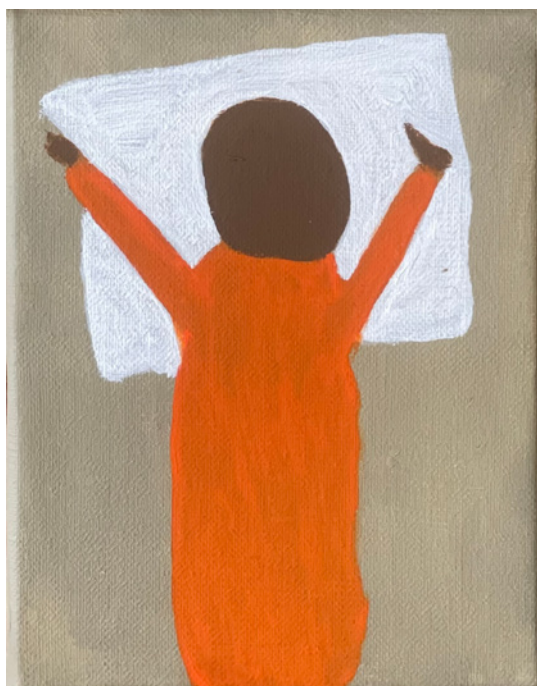
Alain Veinstein, Sans titre , acrylique sur toile, 20 x 15 cm, 2023