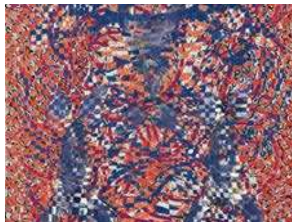
FRANÇOIS ROUAN PALIMPSESTES

Jusqu'au 15.04 - Galerie etc, 3 e galerie-etc.com