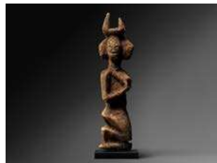
PARIS TRIBAL 10 e ÉDITION

Jusqu'au 22.04 • Clavé Fine Art, 14 e clavefineart.com