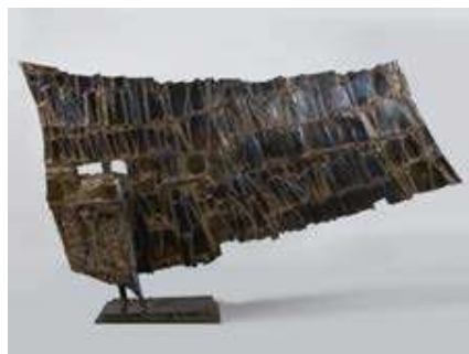
CÉSAR, CLAVÉ, RICHIER AFFINITÉS ÉLECTIVES

Jusqu'au 22.04 • Galerie Dina Vierny, 6 e galeriedinavierny.fr