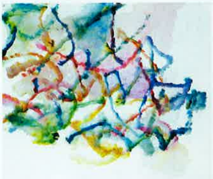
Alexandre Hollan Le Chêne dansant série Rythme de lumière, 2022

«Alexandre Hollan – L'invisible est le visible» du 9 mars au 6 mai • 12, rue des Beaux-Arts • Paris 6 • 01 40 29 97 52 galerielaforestdivonne.com