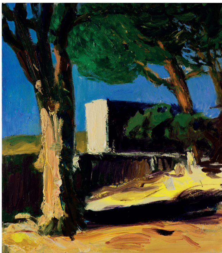
Patrice Giorda, Pins et muret , huile sur toile, 81 x 65 cm, 2022