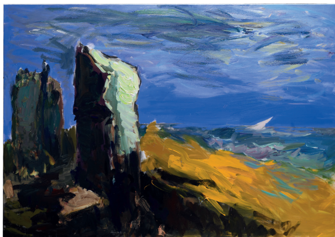
Patrice Giorda, Le Château des Hadleigh n°19 , acrylique sur toile, 114 x 162 cm, 2018

Nocturne jeudi 1 er juin jusqu'à 21h Chromatisme - une exploration de la couleur à Saint-Germain-des-Prés