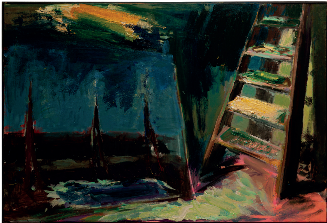
Patrice Giorda, Golgotha dans l'atelier , acrylique sur toile, 97 x 130 cm, 2023

Au cours des années 2000, Patrice Giorda peint de nombreux paysages avec une touche dense et compacte : des mers démontées, des villages calmes ou encore de petites aquarelles plus inspirées d'un voyage au Québec. Une des dernières séries importantes s'intitule à juste titre «Le chantier Vélasquez» (2010-2011) et comprend environ une cinquantaine de toiles qui renvoient à une étude obsessionnelle de la peinture du maître espagnol. Ode au génie d'une des figures les plus célébrées de l'histoire de l'art et tentative personnelle de s'en approprier les figures et motifs, ce travail semble illustrer l'essence de l'œuvre de Patrice Giorda : une lutte perpétuelle pour dompter le médium et son histoire.