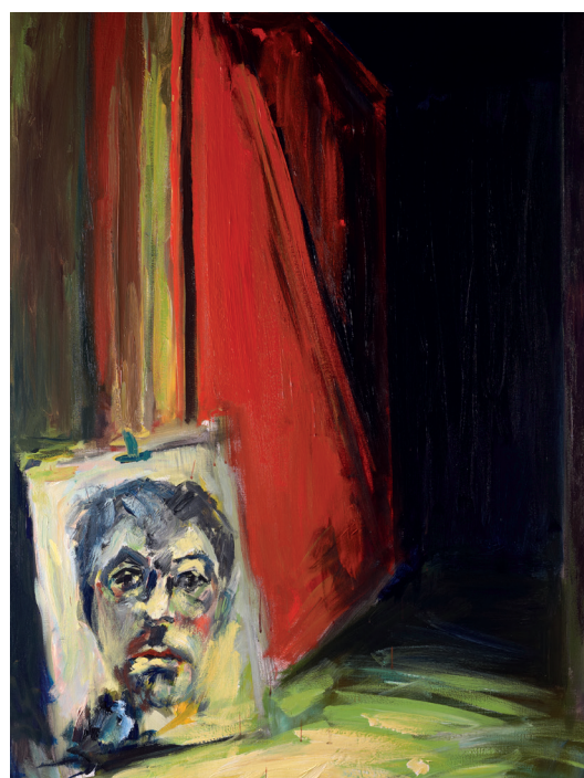
Patrice Giorda, La petite porte rouge , acrylique sur toile, 130 x 97 cm, 2016