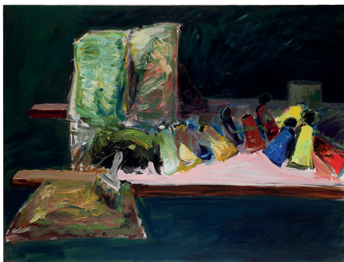
Patrice Giorda, La table de travail n°2 , acrylique sur toile, 97 x 130 cm, 2016