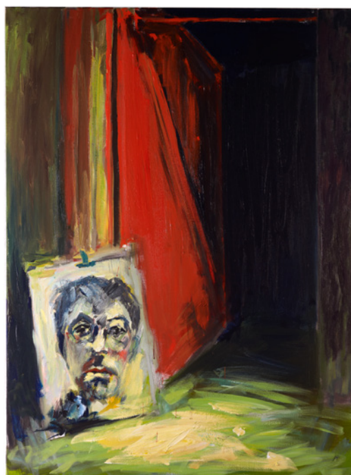
Patrice Giorda, La petite porte rouge , acrylique sur toile, 130 x 97 cm, 2016