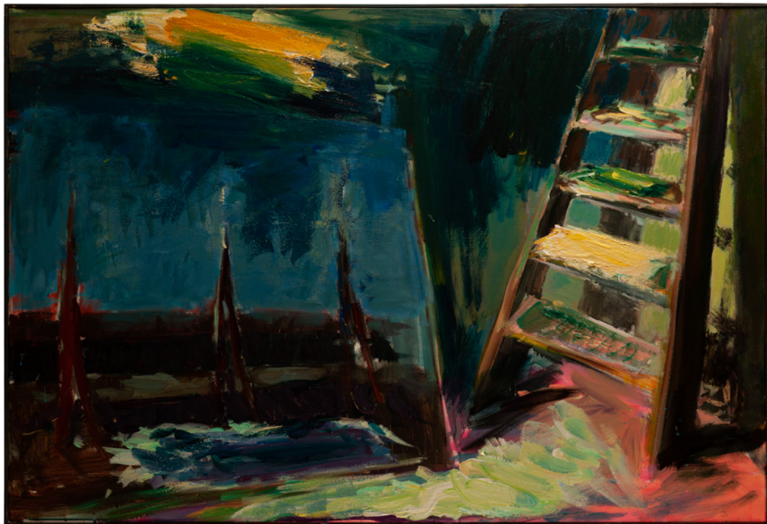
Patrice Giorda, Golgotha dans l'ateleir , acrylique sur toile, 97 x 130 cm, 2023

Au cours des années 2000, Patrice Giorda peint de nombreux paysages avec une touche dense et compacte : des mers démontées, des villages calmes ou encore de petites aquarelles plus inspirées d'un voyage au Québec. Une des dernières séries importantes s'intitule à juste titre «Le chantier Vélasquez» (2010-2011) et comprend environ une cinquantaine de toiles qui renvoient à une étude obsessionnelle de la peinture du maître espagnol. Ode au génie d'une des figures les plus célébrées de l'histoire de l'art et tentative personnelle de s'en approprier les figures et motifs, ce travail semble illustrer l'essence de l'œuvre de Patrice Giorda : une lutte perpétuelle pour dompter le médium et son histoire.