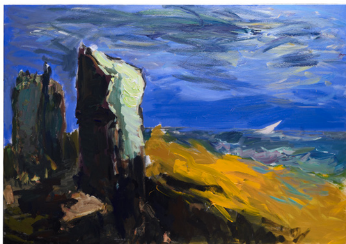
Patrice Giorda, Le Château des Hadleigh n°19 , acrylique sur toile, 114 x 162 cm, 2018