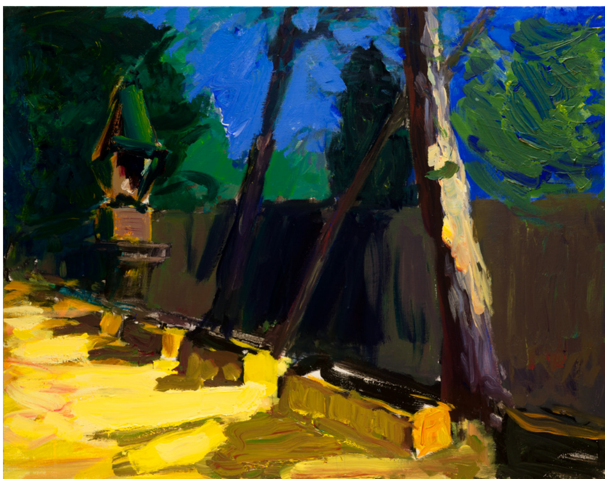
Patrice Giorda, Les Alysamps II , acrylique sur toile, 73 x 92 cm, 2022

VERNISSAGE le mercredi 10 mai 2023 de 17h à 21h