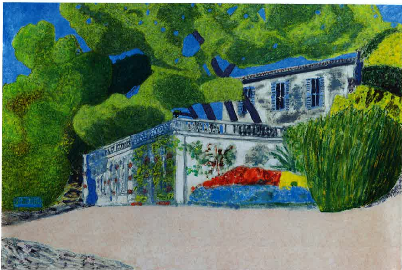
Au Mazet de maman II, huile sur toile, 130 x 195 cm, 2022 © Pierre Schwartz Page de gauche : Le Mazet de M. Stahl 2, huile sur toile, 97 x 130 cm, 2022 © Pierre Schwartz

Ce qui séduit inmanquablement chez Vincent Bioulès, c'est qu'il ne s'en laisse pas compter par les modès et produit, au fil de son inspiration, une peinture pleine de vie, de luxuriance, qui emprunte, en l'occurrence, avec une jubilation palpable, aux codes du fauvisme et sublime les paysages de son enfance méditerranéenne. Ses « lieux de mémoire » viennent ici enrichir une œuvre initiée voici déjà près d'un demi-siècle avec le mouvement Support/Surface (et l'insipide Viallat). Depuis longtemps revenu à la « vraie » peinture, et à une figuration généreuse, toute en matière, Vincent Bioulès explore dans cette nouvelle série ses souvenirs d'enfance, au sein desquels la Nature tient la place d'honneur, au fil de jardins enchanteurs.