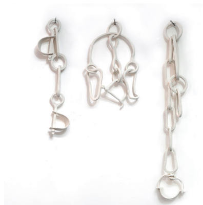
Rachel Labastie, Entraves , Porcelaine et clous d'acier, modelage, 162 cm, 2011