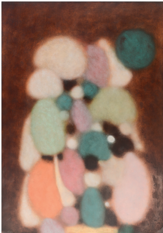
Jeff Kowatch, Sophisticated lady , Huile sur lin, 119 x 84 cm, 2023