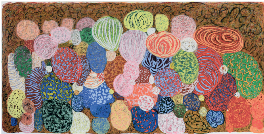
Jeff Kowatch, Untitled , Oil bar on dibond, 150 x 300 cm, 2023