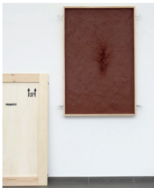
Rachel Labastie, Série caisse Le Coeur du corps , Rauwe klei en hout, 148 x 98 x 11,5 cm, 2020

Brussels Expo, Halls 5 & 6, Place de la Belgique 1, 1020 Brussels