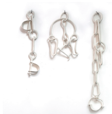
Rachel Labastie, Entraves , Porcelain and steel nails, modeling, 162 cm, 2011