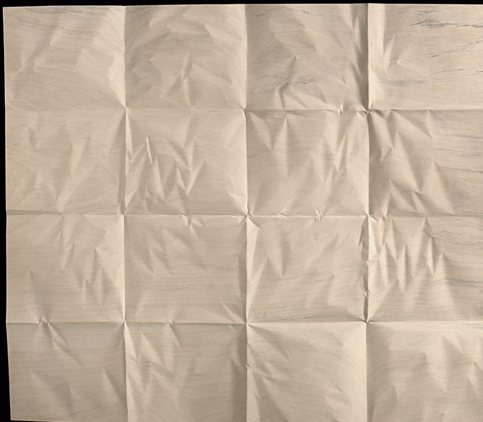
Christian Renonciat, Déplié seize plis , bois d'ayous, 158 x 161 x 5 cm, 2019

Parallèlement à cette exposition, la galerie présentera une sélection des sculptures de Christian Renonciat sur son stand à la BRAFA du 29 janvier au 5 février 2023.