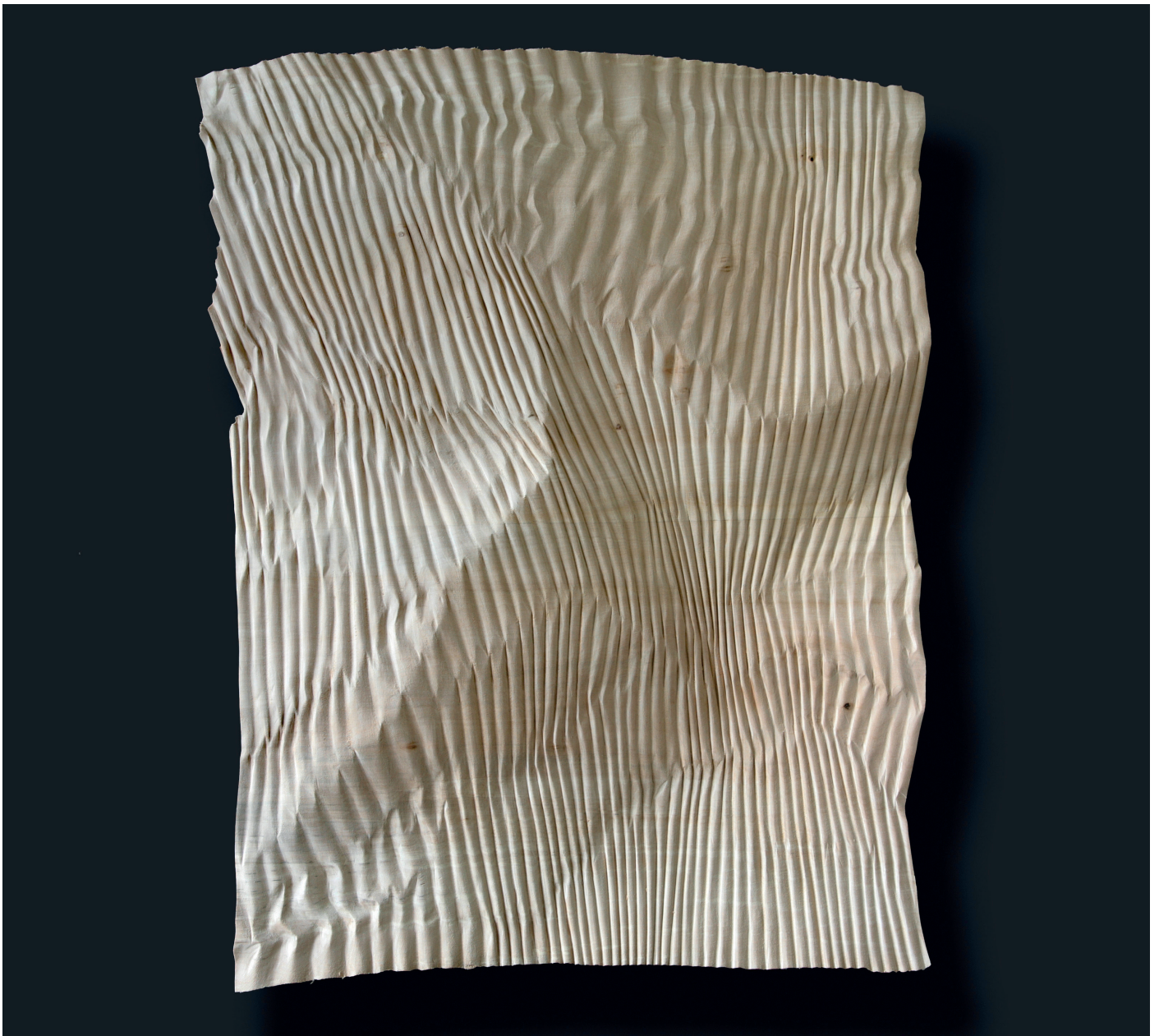
Christian Renonciat, Ondée 1 , bois de tilleul, 75 x 60 x 6 cm, 2022

VERNISSAGE le jeudi 12 janvier 2023 de 17h à 21h