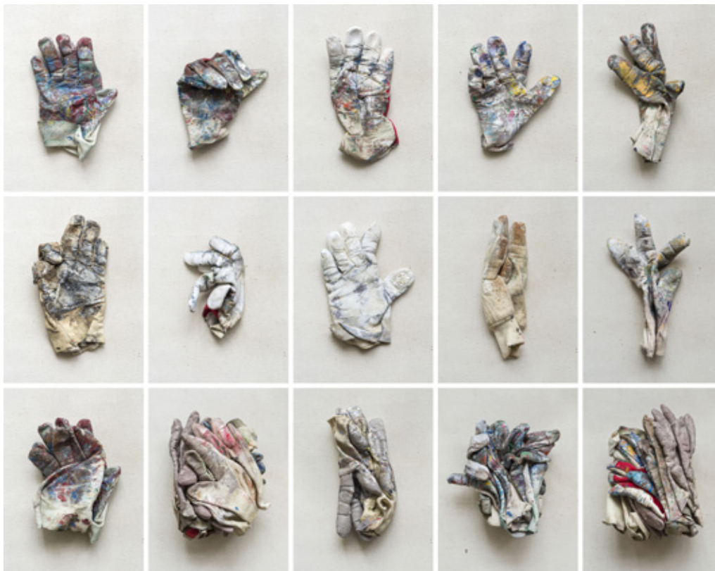
Illés Sarkantyu, Gants (ref : ER), 15 tirages pigmentaires, 40 x 30 cm, éd. 5 ex. + 2. E.A, 2022

Son écriture diverse et riche, son regard acéré et sensible lui donnent une grande liberté au service de sa créativité.