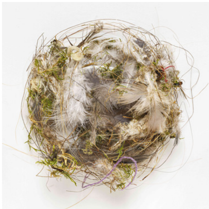
Illés Sarkantyú, Sans titre , série «Romantique, Clinique, Iconique», 50 x 50 cm, tirage pigmentaire, Ed. 3ex+ 2EA, 2013

Sa contribution dans le domaine de la photographie est telle qu'en 2017, Didier Quilain est nommé au grade de Chevalier dans l'ordre des Arts et Lettres.