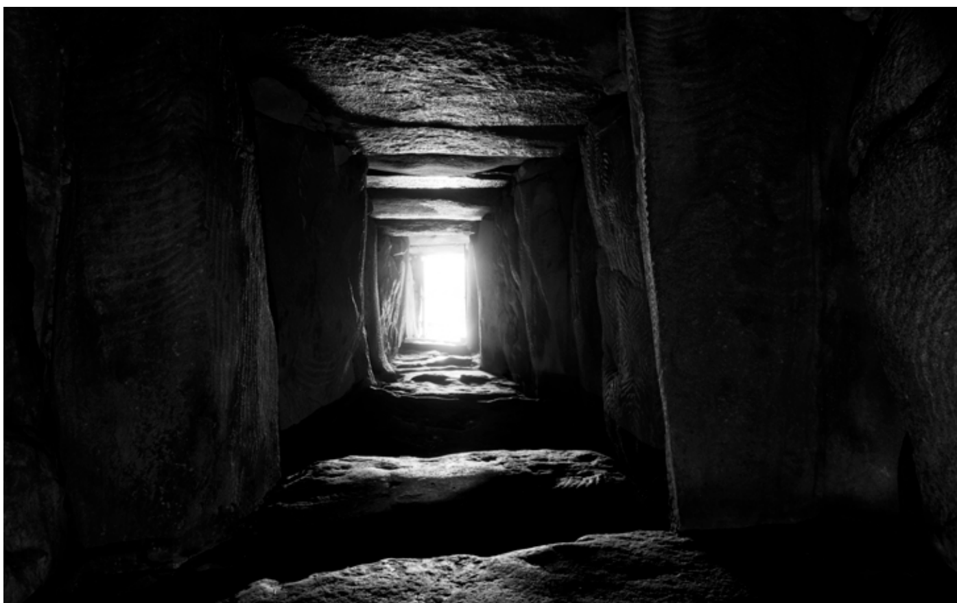
Illés Sarkantyu, Gavrinis, chambre avec vue , série «Gavrinis», tirage pigmentaire, 45 × 72 cm, Ed. 5ex+ 2EA, février 2017

VERNISSAGE jeudi 13 octobre de 18h - 21h