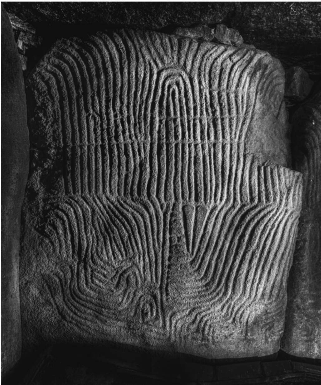
Ilés Sarkantyu, Gavrinis , Dalle no 16 , série «Gavrinis», tirage pigmentaire, 180 x 150 cm, Ed. 5ex+ 2EA, février 2017