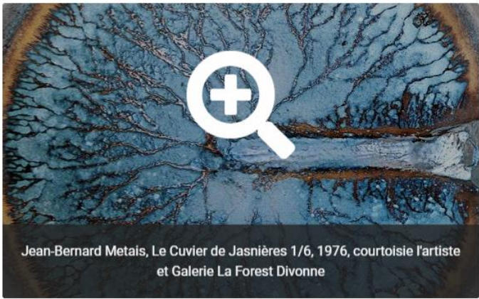
Jean-Bernard Metals, Le Cuvier de Jasnieres 1/6, 1976, courtoisie l'artiste et Galerie La Forest Divonne