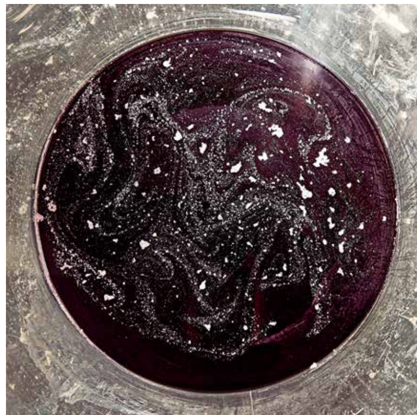
Jean-Bernard Métais, Le Cuvier de Jasnières, 2 sur 6 + 1EA, tirage pigmentaire, 110x110cm, 2011.