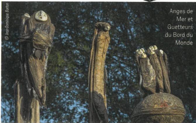
Anges de Mer et Guetteurs du Bord du Monde