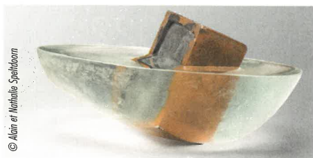
Screen, bronze et résine, 2019