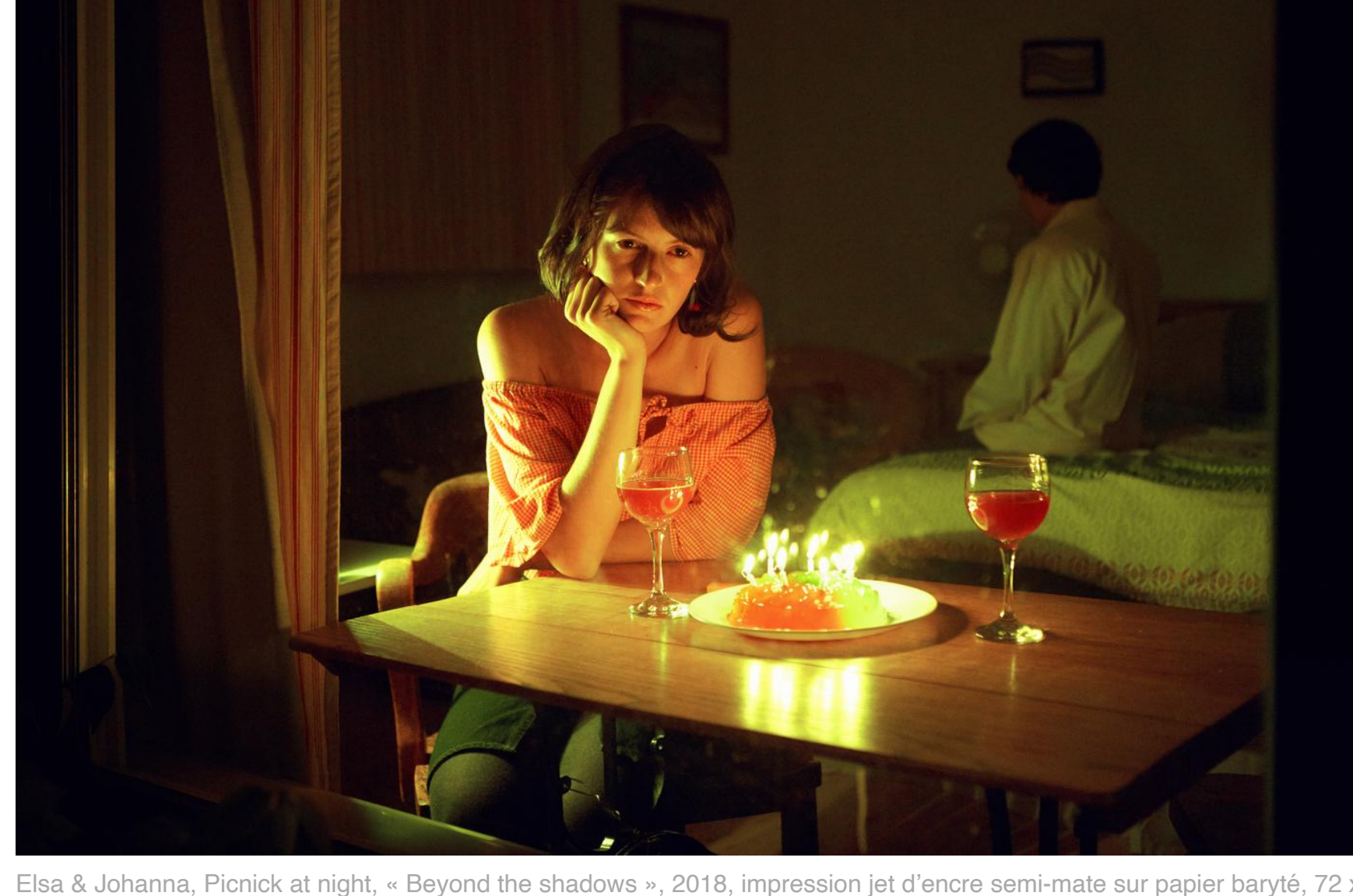
Elsa & Johanna, 'Picnick at night, - Beyond the shadows -', 2016, impression jet d'encre sur papier baryté, 72 x 108 cm.

De la Méditerranée des années 30 à la Côte d'Ivoire actuelle, en passant par les réalités fictives des collages, un véritable road trip !