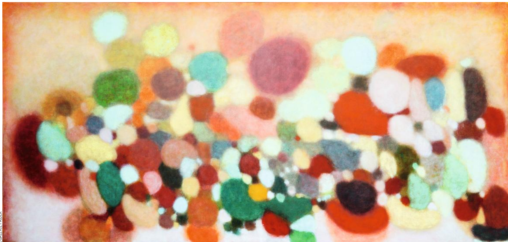
Jeff Kowatch, Man Jok, Oil on linen, 2021, 180 x 375 cm

Trois expos sur Bruxelles, l'une clôturée déjà, les deux autres en mode terminal: il faut courir s'imprégner des couleurs Kowatch!