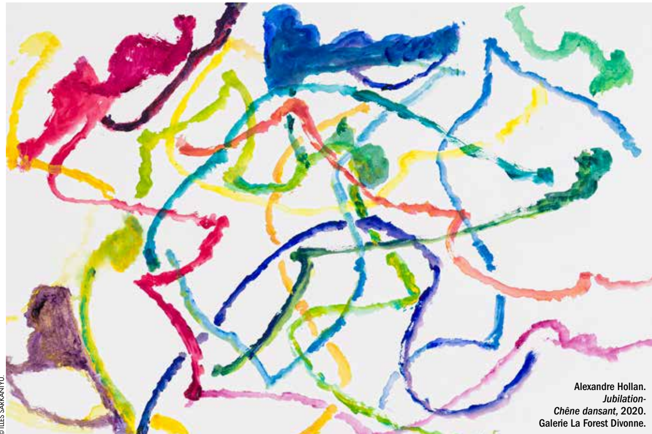
Alexandre Hollan. Jubilation- Chêne dansant, 2020. Galerie La Forest Divonne.