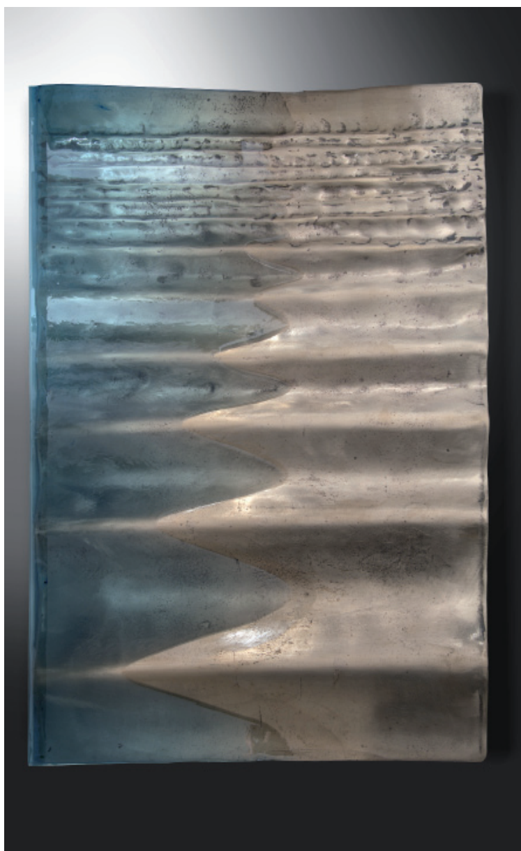
Catherine François, Tsunami , Bronze et résine, 65 x 45 cm

Elle écoute la nature, la ressent et la sculpte à travers des vibrations qu'elle représente par des vagues (Waves) où chaque corps et objets vibrent.