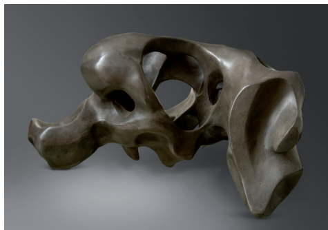
Catherine François, Tomorrow's man III , Bronze et nitrate d'argent, 25 x 50 x 24 cm, 2015