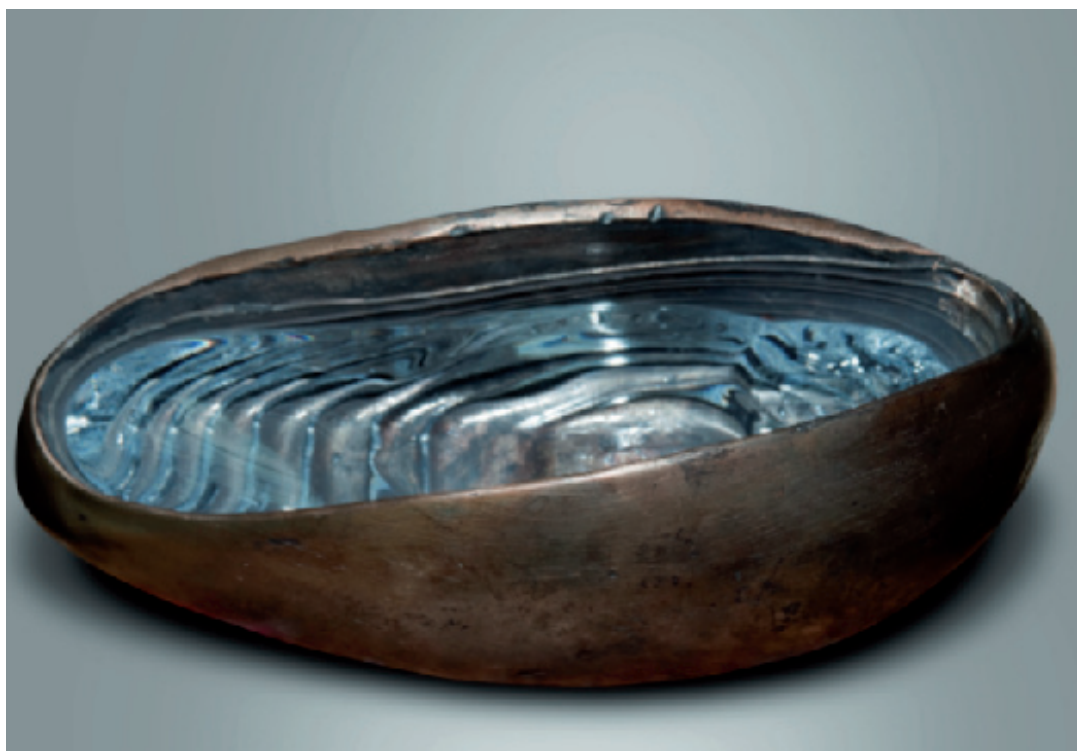
Catherine François, Deeper , 2011, bronze et verre, 28 x 13 x 15 cm

Après le succès de l'exposition à Bruxelles, la Galerie La Forest Divonne Paris est très heureuse de présenter à son tour les sculptures de la belge Catherine François.