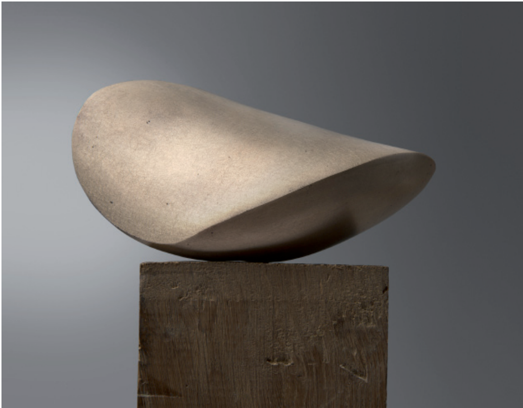
Catherine François, Little Wave , 2019, bronze, 19 x 9 x 7 cm

À travers ses créations, elle crée un lien entre la représentation de l'homme et son emprise sur la nature.