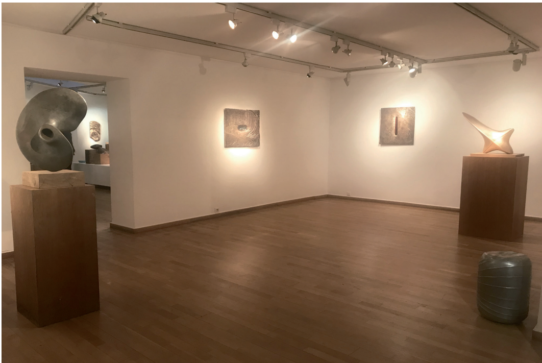
Vues d'exposition Waves de Catherine François à la Galerie La Forest Divonne - Paris, 2019