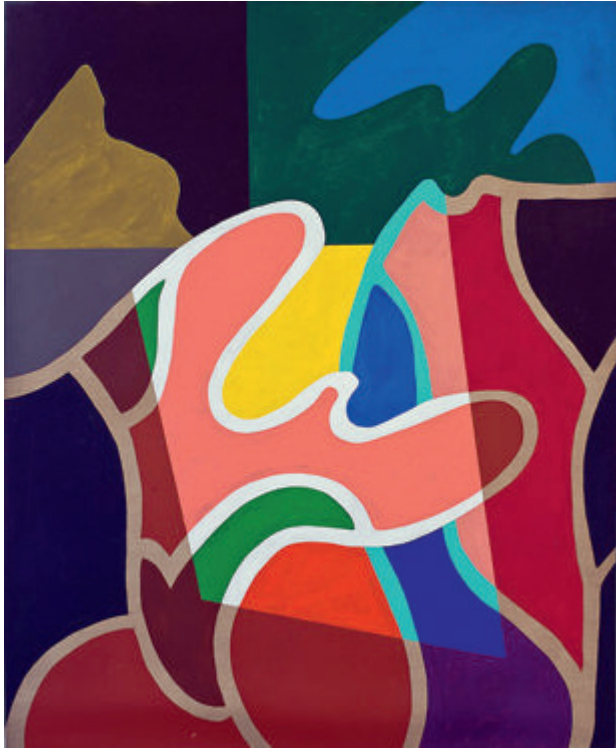
GALERIE ALIÉNOR PROUVOST - BRUXELLES - 2019