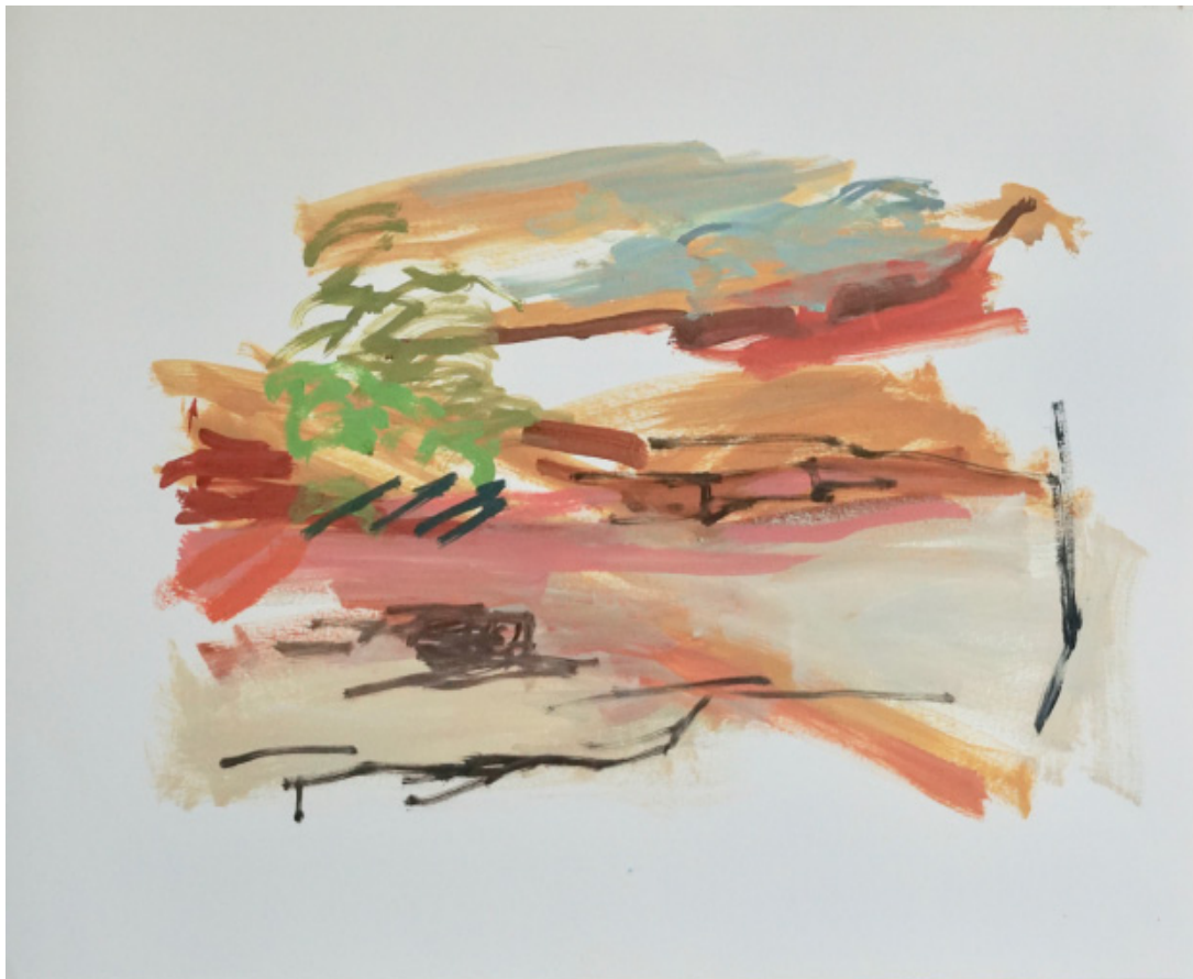
Herta MÜLLER 2/18, 2018 Huile sur papier, 50 x 65 cm