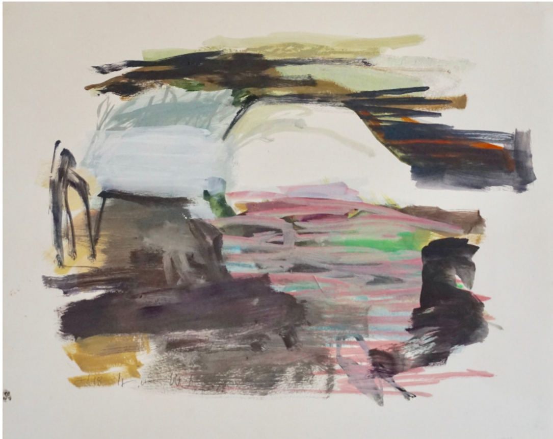
Herta MÜLLER 7/18, 2018 Huile sur papier, 50 x 65 cm