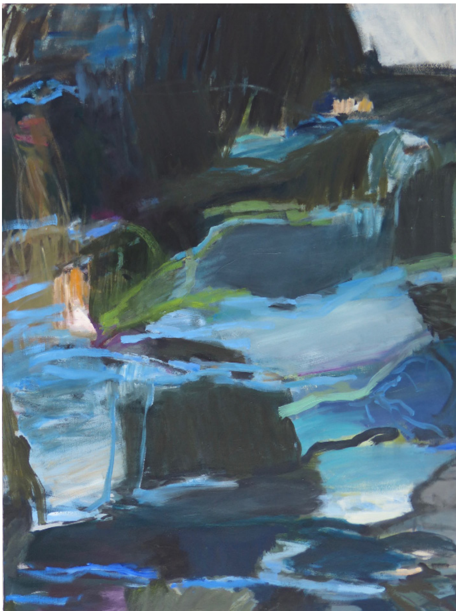
Herta MÜLLER, blaues Licht , 2015, Huile sur toile, 100 x 90 cm