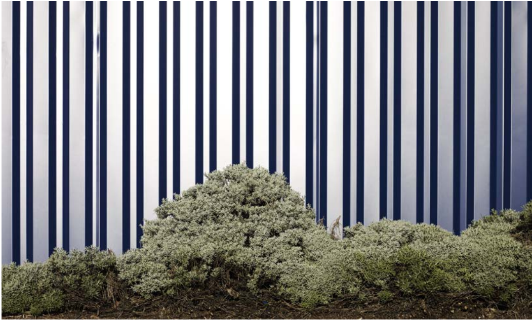
Jérôme BRYON, Landscape 01, Grand Sud , 2013, C-Print, 100 x 60 cm, Edition de 6 + 3 EA

Later, in 2012-2013, brengen de zwerftochten van Jérôme Bryon hem tot aan zijn woning. Hier ligt Grand Sud, een groot overdekt winkelcentrum in de regio van Montpellier. Een decor van golfplaten, massaconsumptie en massavertier. Behoorlijk deprimerend dus. Bryon brengt er twee jaar door. Hij gaat op zoek naar details, naar schoonheid, naar ontsnappingswegen in deze gemaakte en harde wereld. We zijn niet zo ver van de hotelkamer verwijderd. Het is allemaal een kwestie van kijken, tijd en aandacht. Uit hun context gehaald, lijken bepaalde beelden uit deze reeks grote, steile bergen. Het zijn niet meer dan de grote stenen die de parking van de Carrefour afbakenen. Op andere beelden zou je denken dat de fotograaf door de zentuinen van het oude Japan kuiert. Maar neen, u bent nog altijd in Grand Sud , en deze struik maskeert eigenlijk de muur van golfplaten van de winkel. Detail en schaal.