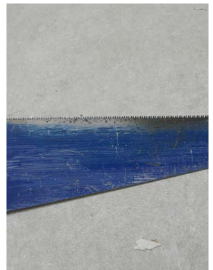
Jérôme BRYON, Sous-œuvre 01 , tirage argentinique, 70 x 90 cm, 2011, édition de 6

Uiteindelijk kan men zich afvragen of het niet de stilte is, het echte onderwerp van Jérôme Bryon, dat net zo goed de vijandigheid van de omgeving als het overlevingsmiddel materialiseert, dat de lens vastlegt in een omgeving verzadigd met beelden en geluiden.