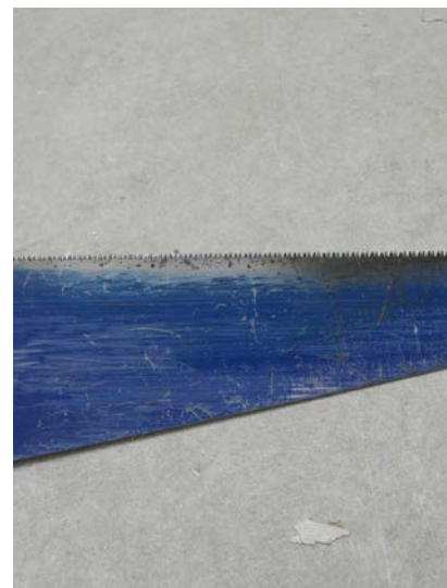
Jérôme BRYON, Sous-œuvre 01 , tirage argentin, 70 x 90 cm, 2011, édition de 6

Enfin, on peut se demander si ce n'est pas le silence, le vrai sujet de Jérôme Bryon, matérialisant autant l'hostilité des lieux que le moyen de survie qu'offre l'objectif dans un environnement saturé d'images et de bruits.