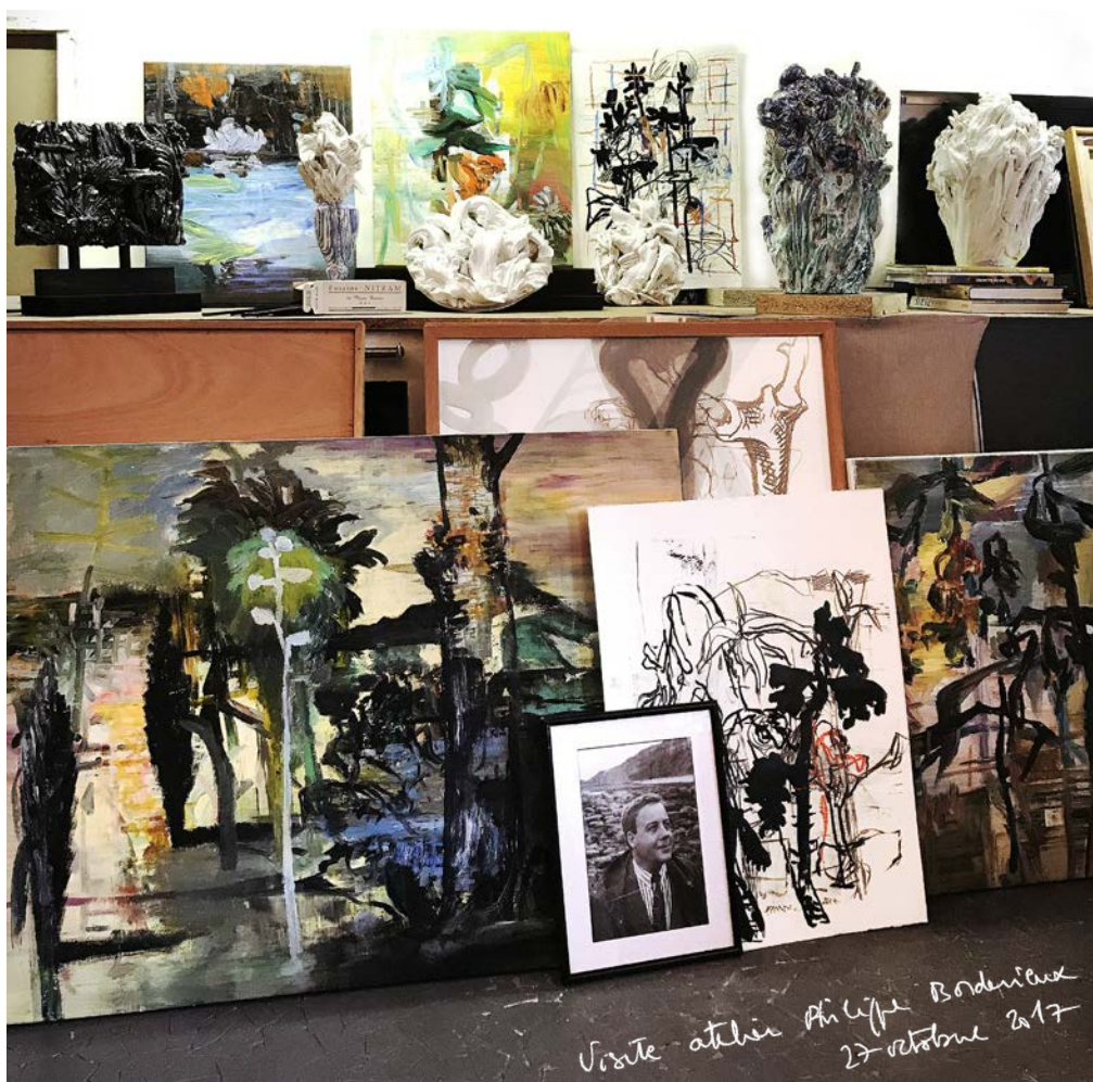
Atelier de Philippe Borderieux