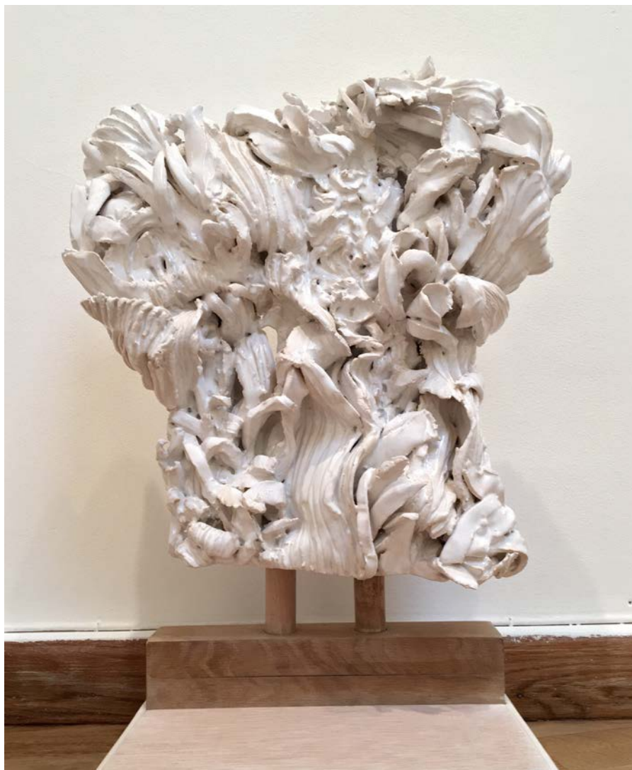
PHILIPPE BORDERIEUX, Hortus , 2016, 50 x 36 x 21 cm, sculpture en céramique

Chacune de ses œuvres dépeint une atmosphère passée qui ressurgit en vagues, et nous immerge dans un environnement de formes végétales, aux couleurs tantôt douces, tantôt sombres et violentes.