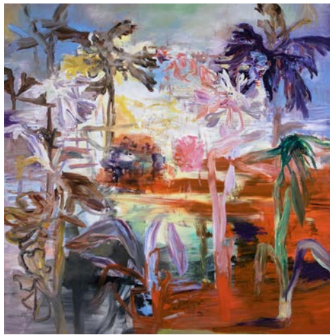
PHILIPPE BORDERIEUX, Monte di procida , 2016, 100 x 100 cm, acrylique sur toile