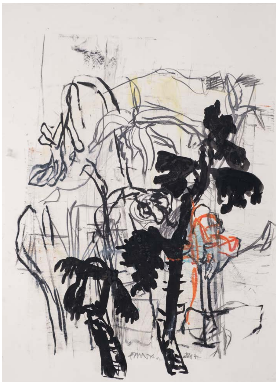
PHILIPPE BORDERIEUX, Herbier 5 , 2017, 56 x 77 cm, Crayon, Encre de Chine, Pastel

En un sens sa démarche répond donc à une véritable approche archéologique, puisqu'il retranscrit l'image d'une nature calcinée, comme une réminiscence de son enfance. Son œuvre devient alors un véritable « conservatoire d'émotions ». Il écrit d'ailleurs très justement : « j'ai dans l'atelier, transformé les paysages de mes vies en herbier de l'avant monde ». L'intérêt qu'il porte pour les fleurs fanées illustre parfaitement cela ; il confie lui-même « c'est ce qu'on ne regarde plus qui me plaît ».