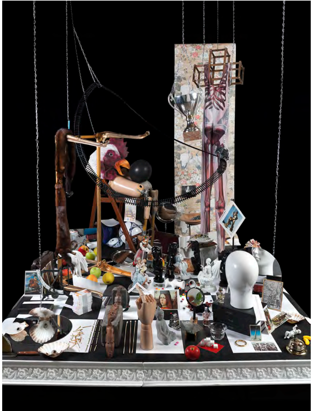
OLA LANKO, Pride , Installation, 2016