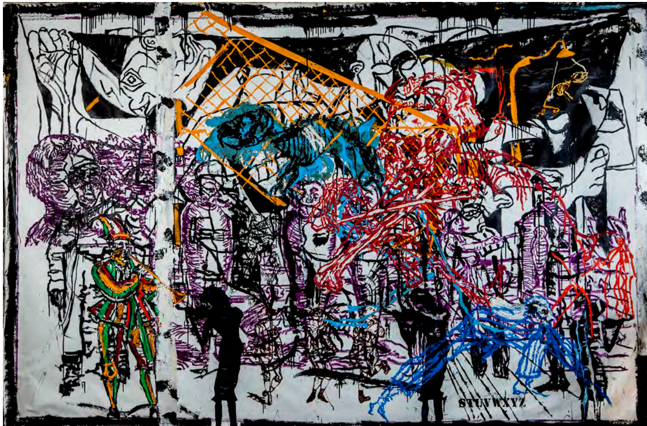
ORSTEN GROOM, NACHSPRECHEN , 200 x 300 cm, Huile & Glycero sur toile, 2015