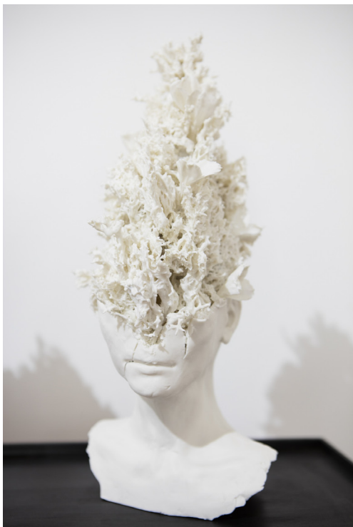
Samuel Yal, Noevus - Tête lichen I , porcelaine, 39 x 17 x 17 cm env., 2016.

du 13 décembre 2017 au 10 février 2018 van 13 december 2017 tot 10 februari 2018