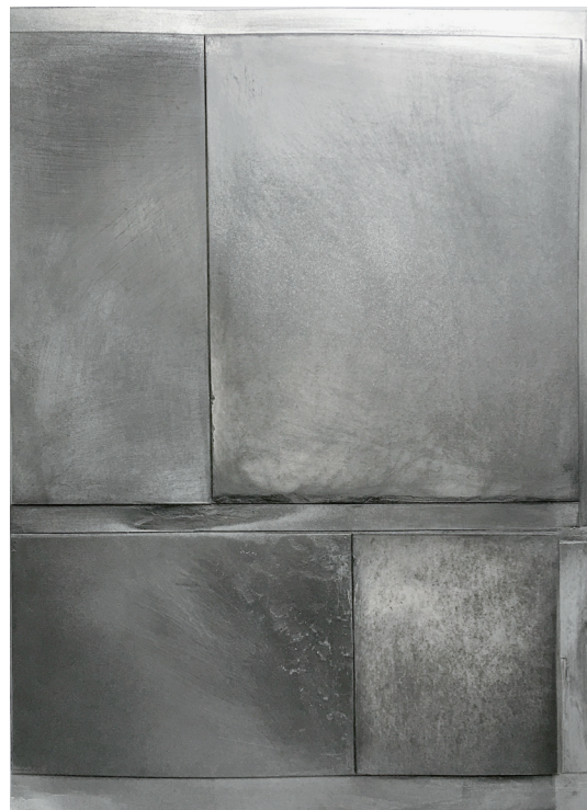
Bruno Albizzati, Sans-titre (composite) 6 , 2016, graphite, fusain crayon lithographique et peinture aérosol et collages sur cartons, 81,5 x 60 cm