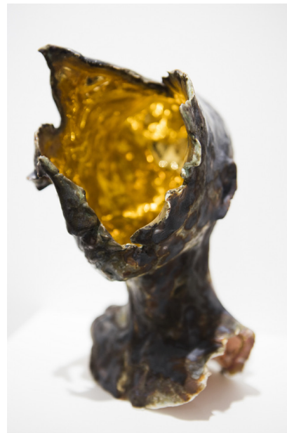
Samuel Yal, Noevus - Tête or III , porcelaine émaillée et or, 25 x 16 x 16 cm, 2016 - Courtesy Galerie Ariane C-Y

Ook de creaties van Yal zijn vaak gefragmenteerd. Hij takelt zijn werken eveneens toe omdat hij de naar het leven gebeeldhouwde lichamen en gezichten toont in een diepgaand mutatieproces. Sommige stukken stellen eenvoudigweg een opeenhoping van koraal en korstmoss, of een oor of tepel voor. Volgens Samuel Yal krijgt de toeschouwer de binnenkant van zijn beeldhouwwerken te zien als deze zouden breken. Zijn het resten van een vroeger leven of de eerste elementen, matrijzen, van een andere levensvorm die zich ontwikkelt? Soms, alsof de toeschouwer getuige is van een bevroren film van een ontploffing, komt een massa van deze kleine, dierlijke en plantaardige organismen uit een gezicht. Nu eens ontsnappen verkoelde hoofden en lossen op in de lucht. Dan weer is een gebroken hoofd met bladgoud opgelapt, zoals die Japanse restauratietechniek die barsten in beschadigde keramiek niet verbergt maar integendeel idealiseert.