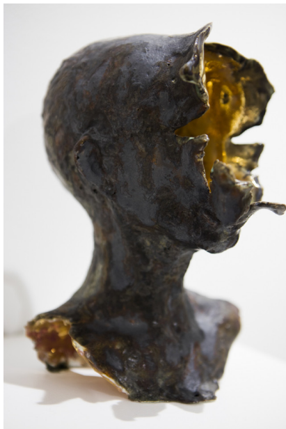
Samuel Yal, Noevus - Tête or II , porcelaine émaillée et or, 23 x 15 x 17 cm, 2016 - Courtesy Galerie Ariane C-Y

Calcination, trace, empreinte, ombre, évaporation,... C'est aussi l'univers des vanités que convoquent les œuvres de Samuel Yal et de Bruno Albizzati. Pas nécessairement pour dire que tout va s'arrêter. Plutôt pour interroger le passage d'un état à un autre, pour rester en équilibre entre deux mondes, comme le funambule.