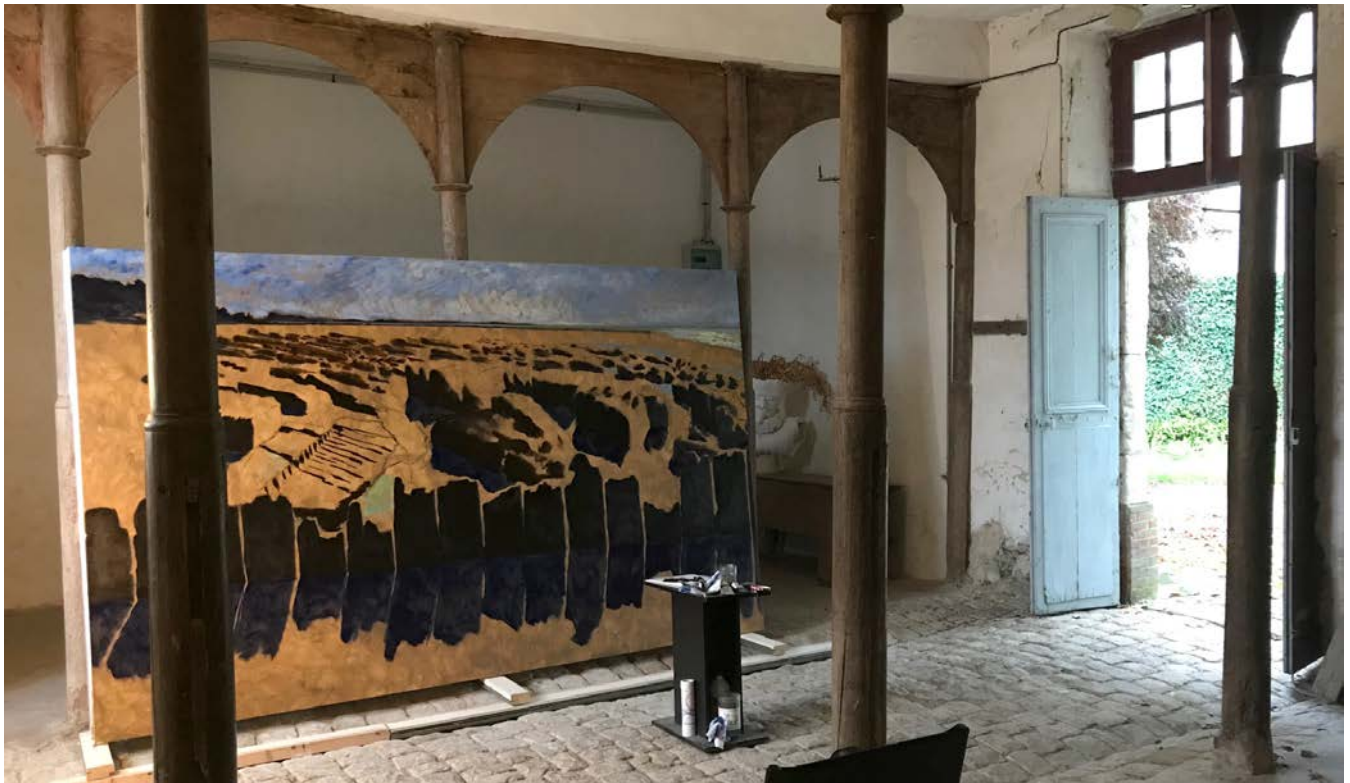
L'atelier de Guy de Malherbe.