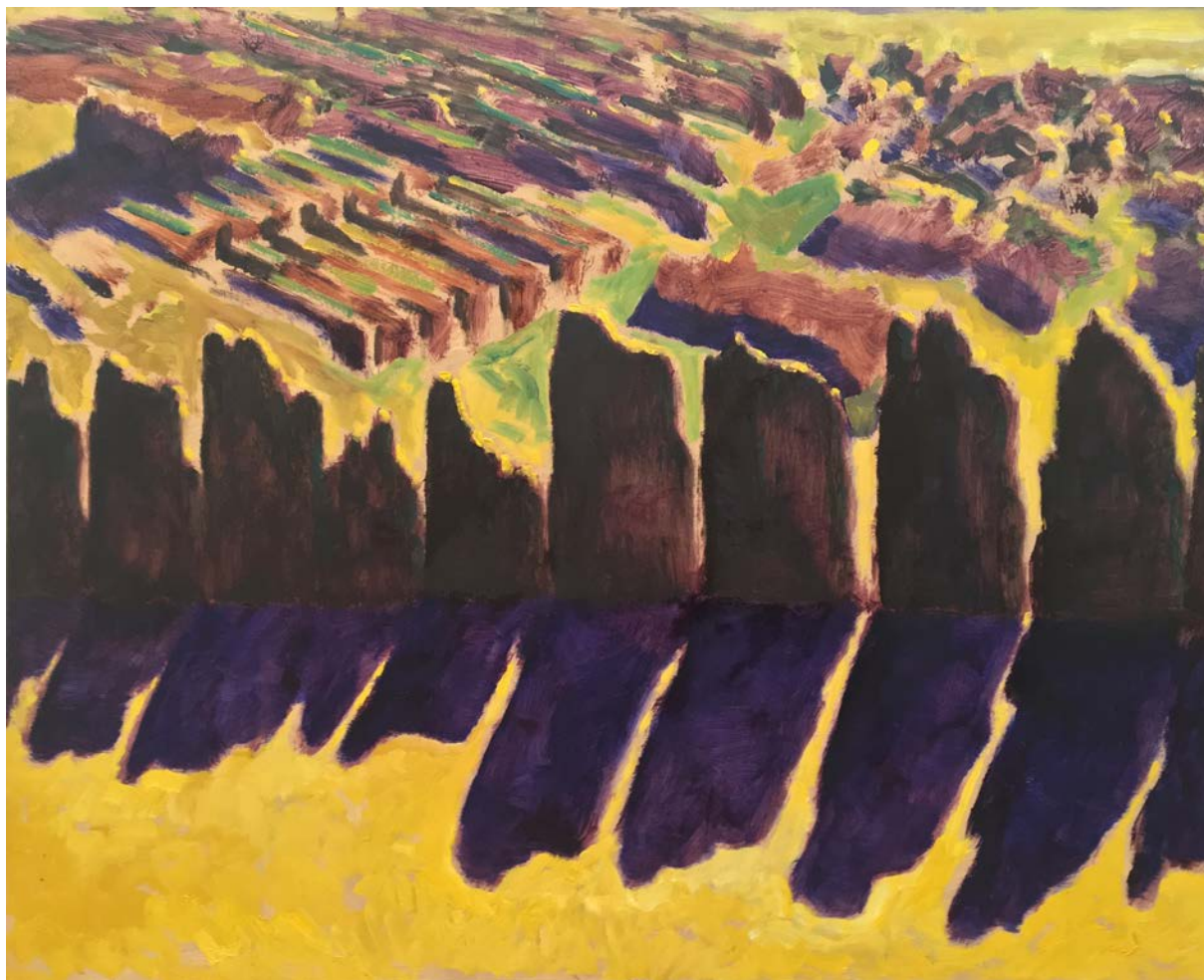
Guy de Malherbe, Stèles , 2017, huile sur toile, 54 x 65 cm