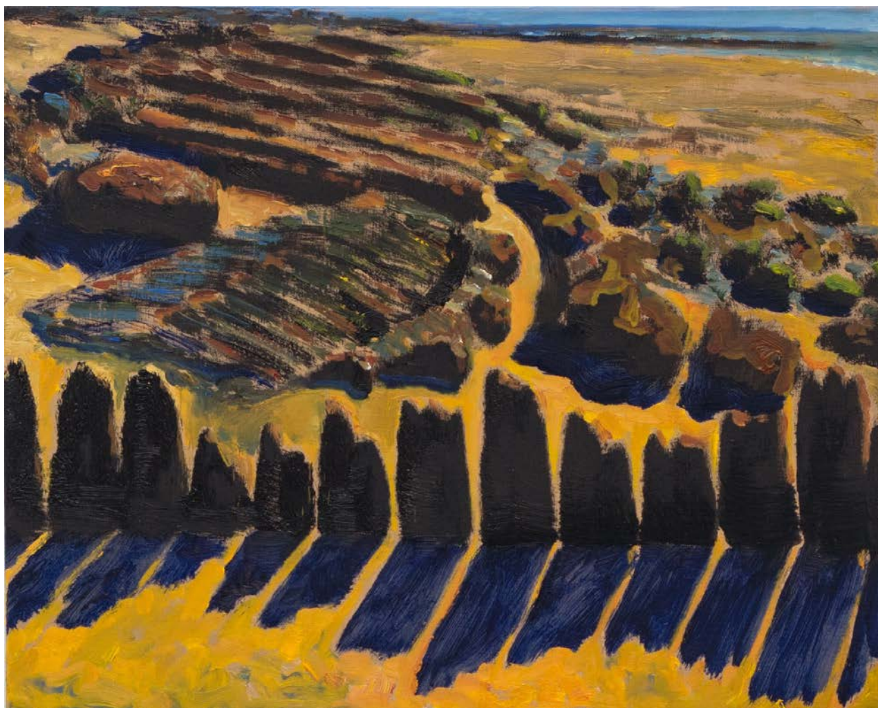
GUY DE MALHERBE, Stèle , 2017, huile sur toile, 33 x 41 cm

Ainsi, dans cette exposition, on verra à nouveau combien l'ancrage dans une expérience physique de la nature reste irremplaçable pour Guy de Malherbe qui d'une œuvre à l'autre, révèle ou dissimule, avec plus ou moins d'intensité, les éléments qui lui sont chers, et qui forment des « images en peinture » comme autant de symboles qui affirment sa peinture comme une œuvre puissamment poétique.