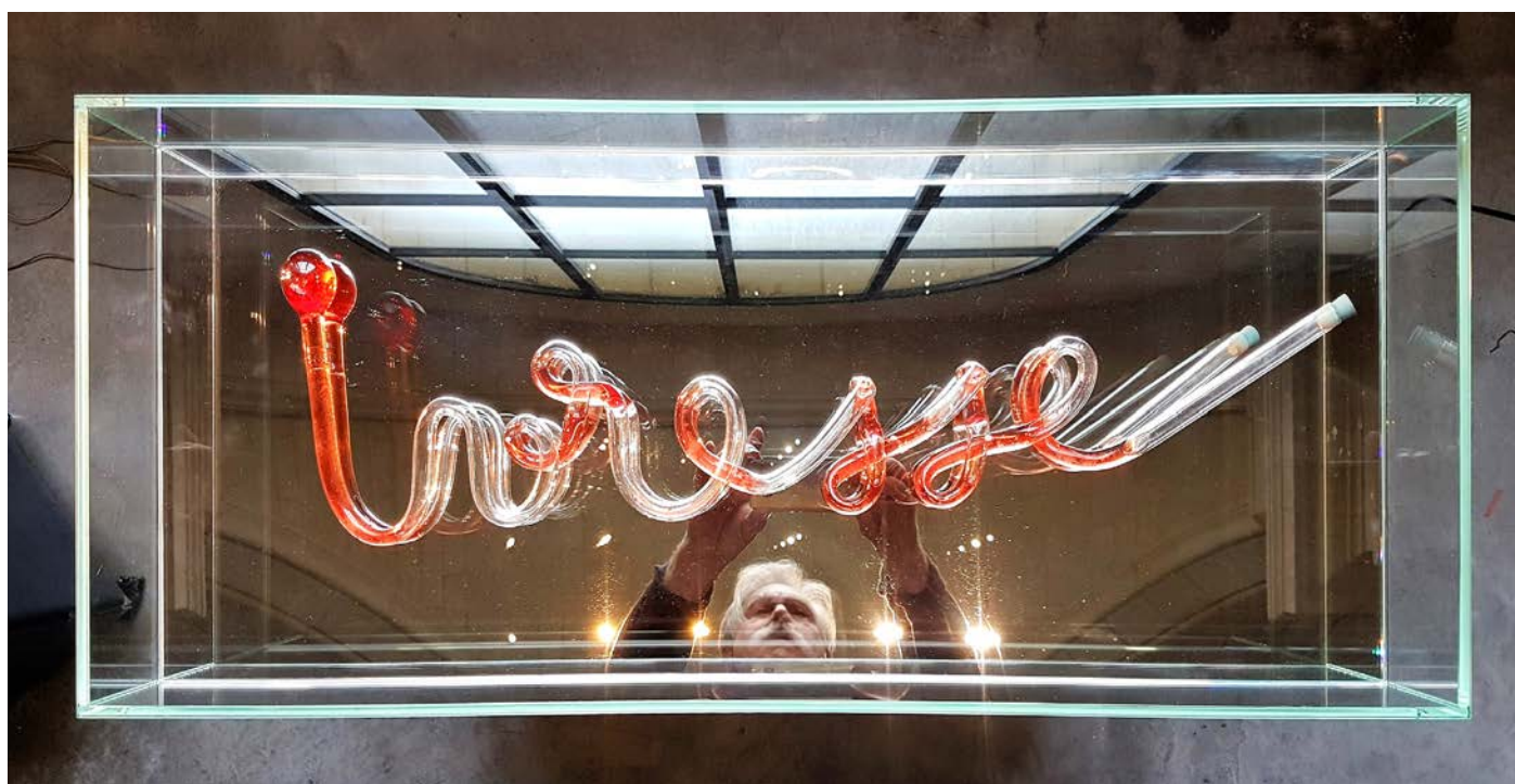
Jean-Bernard Métais, Ivresse , 2017, verre soufflé, miroir et vin Pineau d'Aunis 2016, 70 x 30 x 20 cm