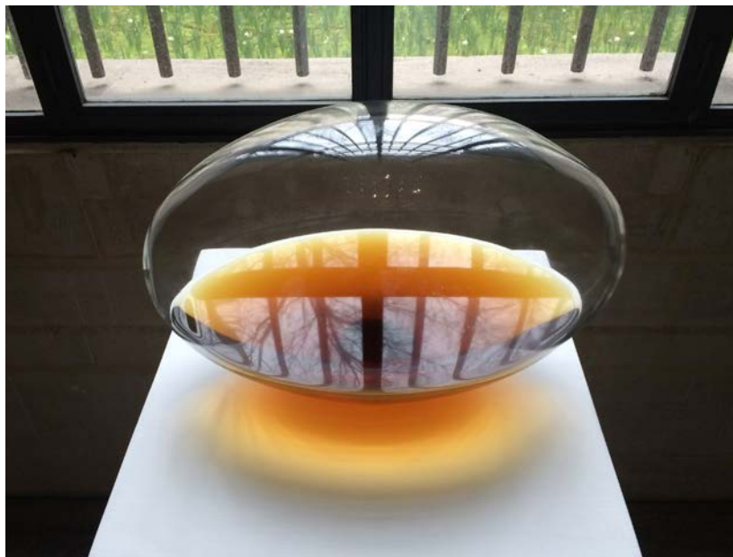
Jean-Bernard Métais, Oblongue/1870 , 2016, verre, Chenin blanc de Jasnières millésime 1870

Ces œuvres en verre soufflé renferment un précieux vin de Jasnières. Les courbes des pièces en verre forment des mots et créent un écho, une résonance au vin qui y est capturé à jamais ! Cette série est un hommage aux paroles gelées que l'écrivain François Rabelais décrit dans son ouvrage Le Quart Livre , paru en 1552. Les personnages du récit manipulent les mots qui, prononcés dans l'air gelé, se matérialisent dans l'espace. Ici les mots sont en quelque sorte « gelés » par le verre ; le caractère fugace et évanescent de la parole est évoqué par l'alcool. Ces créations poursuivent le travail de néons présenté à Bruxelles en mai 2016, en leur donnant une dimension plus personnelle et singulière encore.