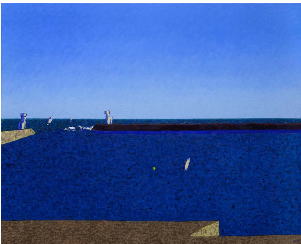
Vincent Bioulès, Le Port de Carnon , huile sur toile, 2016, 130 x 162 cm - © Pierre Schwartz

Une dizaine de grands tableaux constituent le socle de ce nouveau travail où la mer Méditerranée est à nouveau creusée par le peintre, sous toutes ses différentes lumières, principalement à Carnon et à l'étang de l'Or, autour de Montpellier. Quelques incursions à l'intérieur des terres, vers le Pic-Saint-Loup et Donnafugata, feront la transition avec une série de peintures saisies dans le jardin de l'artiste à l'été 2016, dans "une violence de couleurs et de lumières tout à fait singulière" . Des peintures plus petites, des dessins, des temperas, des pastels compléteront cet ensemble en déclinant à leur tour et à leur manière ces thématiques. Ce ne sont pas moins d'une trentaine d'oeuvres inédites qui occuperont les cimaises de la galerie pour cette exposition articulée autour d'une toile monumentale de près de quatre mètres de large.