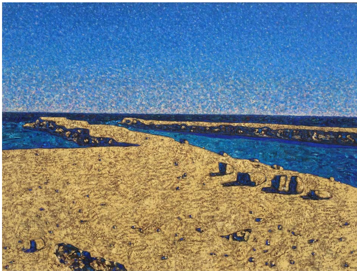
Vincent Bioulès, Le Grau du Prévôt , oil on canvas, 2016 , 150 x 200 cm