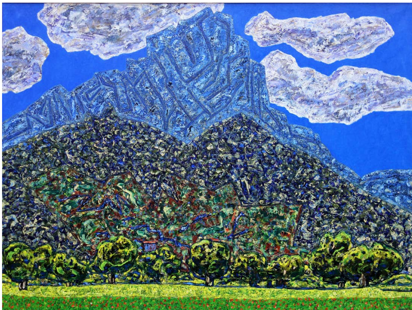
Vincent Bioulès, Le Muscle du printemps , huile sur toile, 2016, 150 x 200 cm