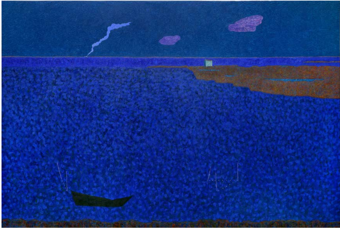
Vincent Bioulès, L'Etang , oil on canvas, 2014, 240 x 347 cm