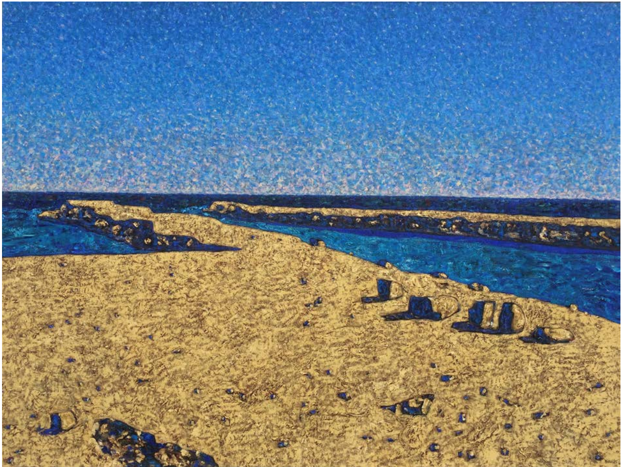
Vincent Bioulès, Le Grau du Prévôt , oil on canvas, 2016, 150 x 200 cm