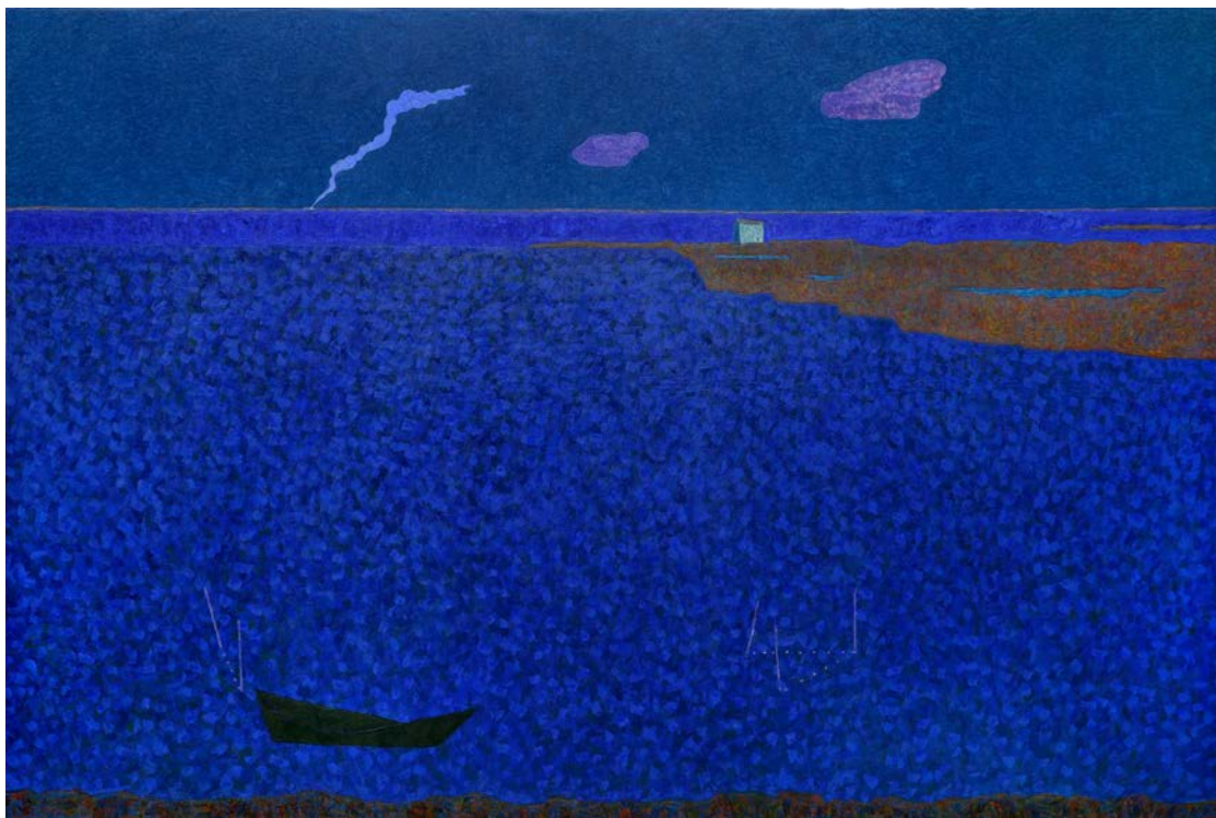
Vincent Bioulès, L'Etang , huile sur toile, 2014, 240 x 347 cm