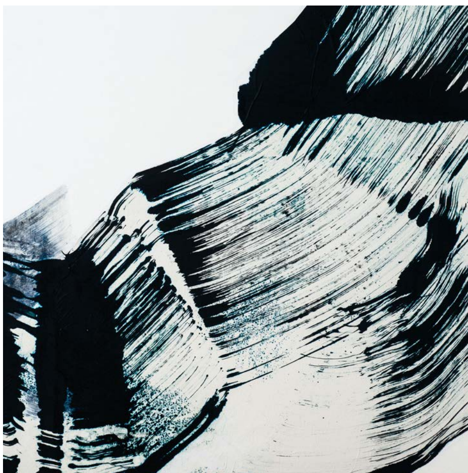
Caribai, Neige-orage (détail) , 2013, technique mixte sur bois, 90 x 180 cm

Vernissage jeudi 26 janvier de 18h à 21h