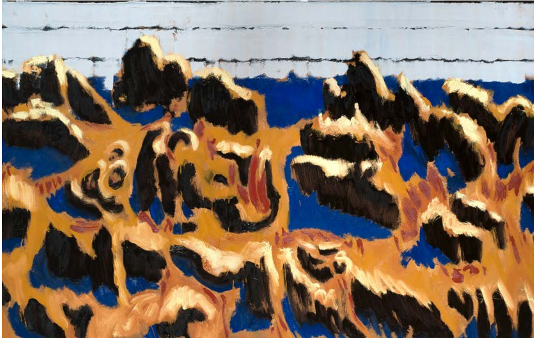
Guy de Malherbe, Falaise, Rythmes et signes , 2016, huile sur toile, 100 x 160 cm

Guy de Malherbe peint par touches généreuses et enlevées, c'est son corps tout entier qui se meut pour faire exister la toile. Il emploie la peinture comme un bâtisseur ; la matière n'est pas seulement présente pour dire la falaise, la plage tourmentée et ses rochers, mais devient elle même craie, sable et roche.