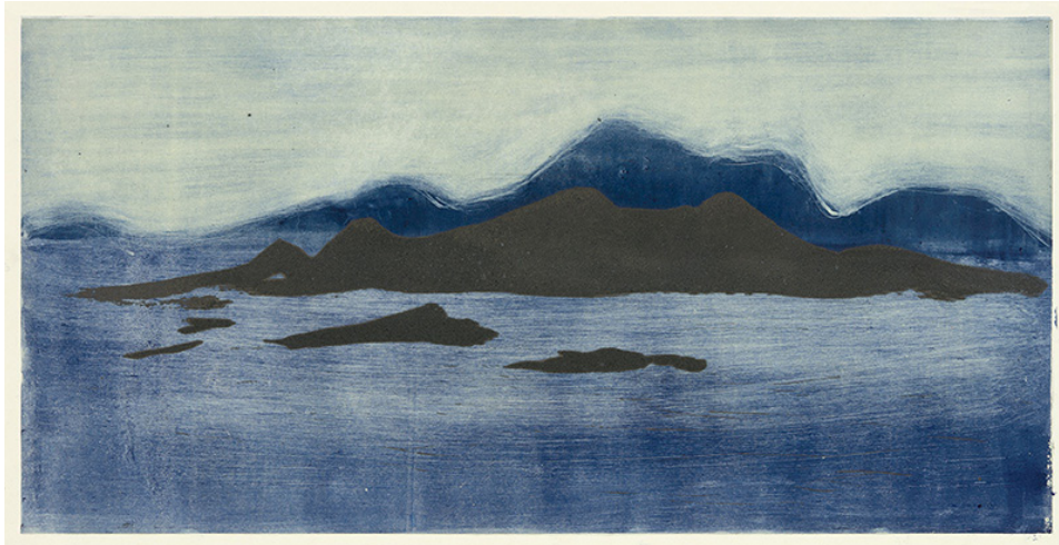
Astrid de La Forest, Magheraclogher I , 2015, monotype et gravure au carborundum sur chine appliquée, 50 x 100 cm

Pour Astrid de La Forest le geste qui découle de l'observation est primordial, si le procédé le met à distance, c'est pour mieux le voir, pour mieux ressentir l'émotion. Dans ses monotypes, le sujet est peint directement sur une plaque de verre, puis la peinture est passée sous presse. La peinture s'en retrouve ainsi inversée, le monotype est le miroir, l'image du geste originel.