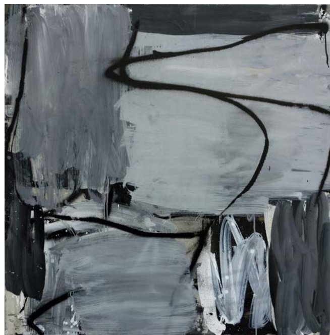
Gilles Altieri, Sans titre , 2013, huile sur toile, 120 x 120 cm

Gilles Altieri , pratique le « All over » en mettant en scène le geste et la peinture jusqu'à saturation, jusqu'au moment où la peinture devient geste et le geste peinture. Il dit lui-même : « Par les cheminements dont mon oeuvre garde les traces visibles, elle s'offre au regardeur sans pouvoir apporter de solution ni de réponse. C'est une pensée opérative dont j'ai l'espoir qu'elle transparaisse à travers les traces visibles du pinceau et de la matière.... »